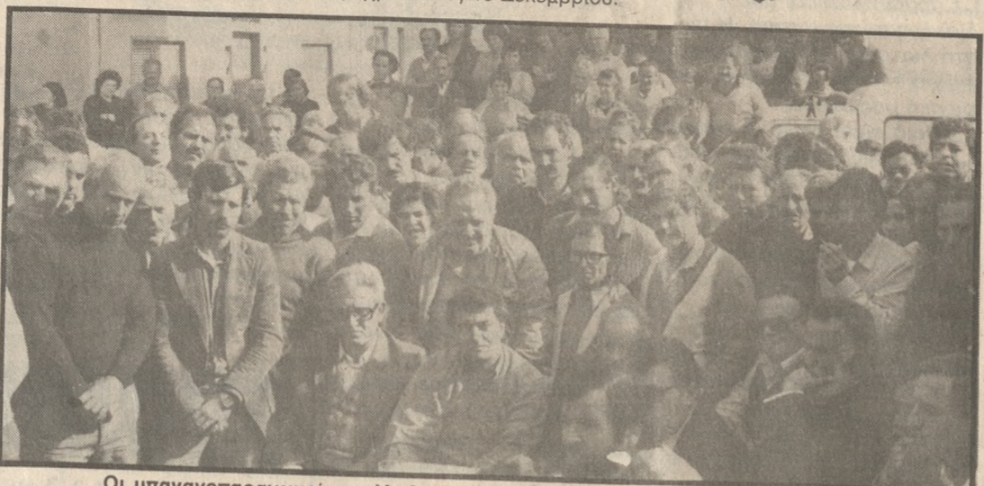
Οι μπανανοπαραγωγοί της Άρβης στην τελευταία τους κινητοποίηση

ομάλιο λώρω των νέων με την υπαίθρο, με το τελευταίο κίνητρο το οικονομικό το αποκόβουμε κατ'επιταγή της ΕΟΚ». Πρέπει να σημειωθεί ότι η προθεσμία εκτελωνισμού (σχέση μέχρι και τις 16 Δεκεμβρίου.