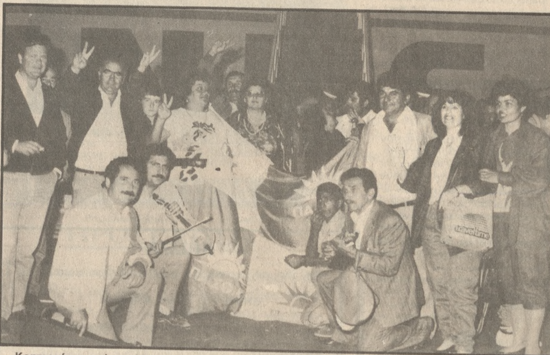
Κρητικούς χορούς με λύρες και μαντολίνα έστησαν χθες το βράδυ πριν την αναχώρησή τους στο Λιμάνι του Ηρακλείου μέλη και οπαδοί του ΠΑΣΟΚ

Σύμφωνα με τις τελευταίες δημοσιογραφικές πληροφορίες ο Πρωθυπουργός θα κατέλθει μόνος του από το αεροπλάνο της Ολυμπιακής (ειδική πτήση) και μόνος του θα μπει στο Πρωθυπουργικό αυτοκίνητο, αφού προηγουμένως χαιρετήσει τα μέλη του υπουργικού συμβουλίου που με επικεφαλής τους δύο αντιπρόεδρους της κυβέρνησης θα τον αναμένουν. Θα ακολουθήσει πομπή αυτοκινήτων από την