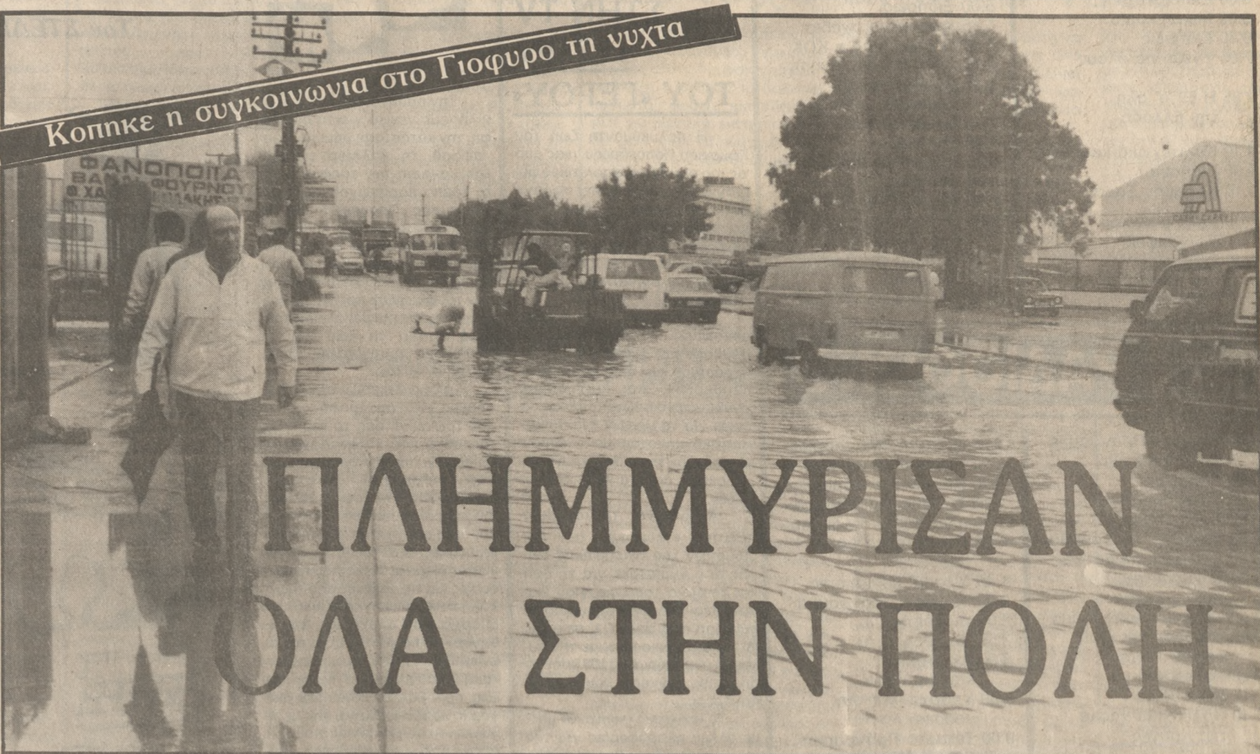
Κοπκκε η συγκοινωνία στο Γιοφύρο τη νυχτα

Το παλιό και ανεπαρκές αποχετευτικό δίκτυο δεν μπορεί, για μια ακόμη φορά, να δεχτεί τα όμβρια νερά με αποτέλεσμα να δημιουργηθούν τα προβλήματα που προαναφέρθηκαν.