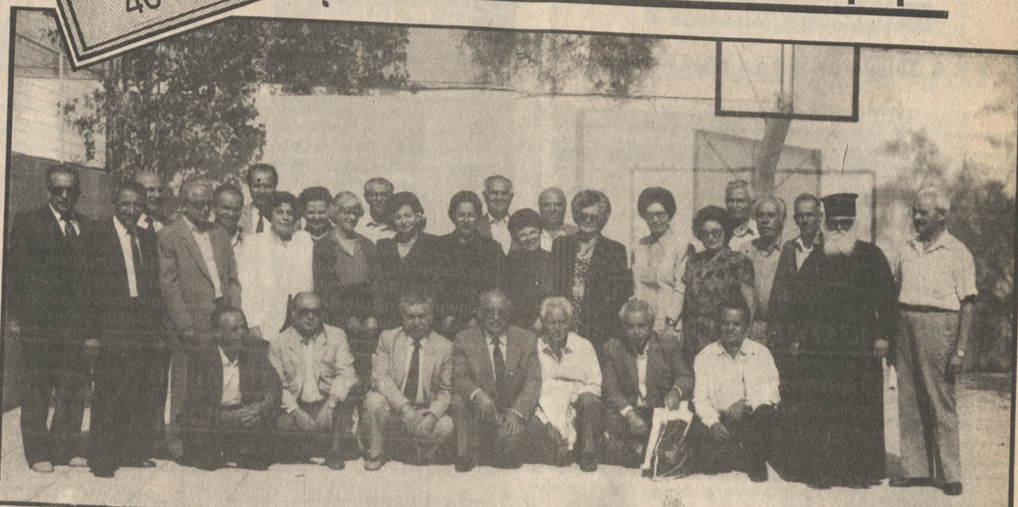
Πριν 48 χρόνια στον ίδιο χώρο αποφοίτησαν της Παιδαγωγικής Ακαδημίας Ηρακλείου οι εικονιζόμενοι εκπαιδευτικοί που συνταξιοδότηση σήμερα ξανασυναντήθηκαν με την ίδια συνοδευτική αγάπη.

Στην οδό Ταξιάρχου Μαρκοπούλου δεσπόζει επιβλητικό από τις αρχές του 19ου αιώνα ένα κτίριο που συνυπάρχει με την ιστορία της πόλης μας σε ηρωικούς και πνευματικούς αγώνες. Τόπος μαρτυρίου αλλά και τόπος που στεγάζει δεκαετίες ολόκληρες τις προσδοκίες νέων ανθρώπων. Κρητικοί αλλά και ελληνοπούλα ν' όλα τα μέρη της ελληνικής γης ξεχύθηκαν απ' εκεί να διδάξουν τα γράμματα σ' όλο το ελληνικό χώρο. Η αναφορά φυσικά αφορά στην παλιά Παιδαγωγική Ακαδημία Ηρακλείου του Ανώτερου πνευματικού ίδρυμα του νησιού ολόκληρης δεκαετίας.