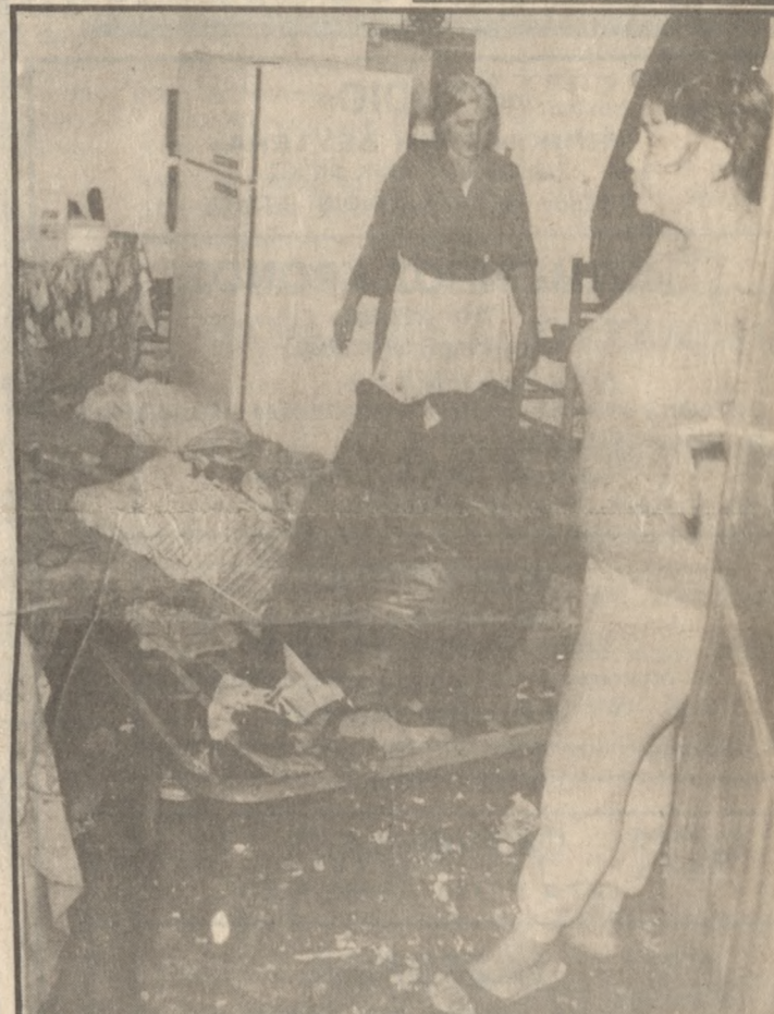
Αυτό είναι το σπίτι της κ. Χωματά... Λίγο μετά την πλημύρα.

Φωτο: ΝΙΚΟΣ ΜΑΛΤΕΖΑΚΗΣ ΤΗΛ. 238-739-220-792