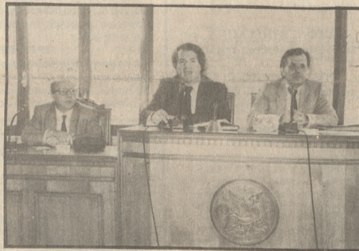
Το προεδρείο της χθεσινής σύσκεψης.