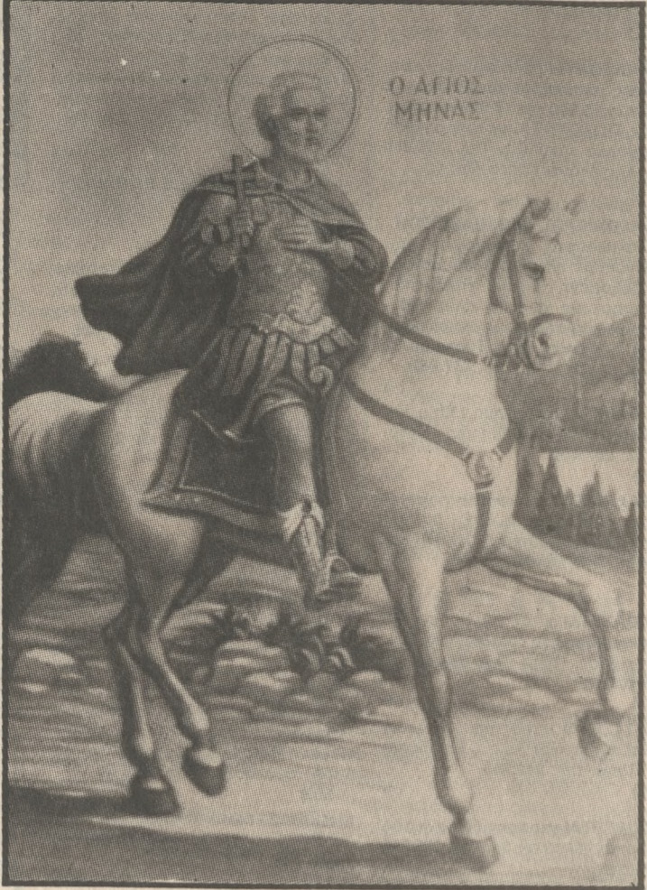
Ο ΑΓΙΟΣ ΜΗΝΑΣ

Δεν ξέρω αν οι άγιοι διαλέγουν τους τόπους ή αν οι τόποι διαλέγουν τους αγίους τους. Πάντως, μου φαίνεται πως, για το Ηράκλειο, δεν μπορούσε να γίνει καλύτερη εκλογή αγίου: Ένα Κάστρο και μάλιστα Μεγάλο (έτσι ονομαζόταν η πόλη στα παλιότερα χρόνια ή έτσι ακούγεται τότε-τότε ακόμη και σήμερα) έπρεπε να 'χει άγιο των αρμάτων για να το προστατεύει. Αυτό, νομίζω, θα σκέφτηκαν οι παλιότεροι Καστρινοί, σαν πιο θεοφοβούμενοι, και κάλεσαν τον Άγιο Μηνά τον καβαλάρη να μένει κοντά τους. Ήταν τότες τα πολυπικραμένα χρόνια της τουρκικής σκλαβιάς. Νσούς οι Χριστιανοί δεν είχαν για να λειτουργηθούν (ο μοναδικός ορθόδοξος ναός που είχαν καταφέρει να κρατήσουν απ' τους Τούρκους ήταν ο Άγιος Ματθαίος) κι ο τότε Μητροπολίτης Κρήτης Γεράσιμος Λατίτζης με φοβερές προσπάθειες στον ίδιο το Σουλτάνο κατάφερε να πάρει στα 1735 (66 χρόνους δηλαδή ύστερ' από την υποδούλωση) την άδεια να επισκευάσει μια εκκλησούλα και να την κάμει Μητρόπολη του.