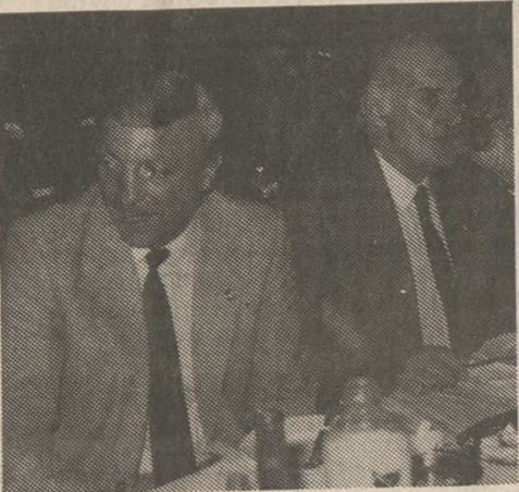
Δείχνει την υπευθυνότητά τους, αλλά και το άριστο κλίμα που επικρατεί στις τάξεις της ΠΑΕ - ΟΦΗ. Σαν εκπρόσωπος της Διοίκησης ευχαριστώ την Διοίκηση, τους ποδοσφαιριστές και τους φιλάθλους της Μαλατία Σπορ για την άψογη φιλοξενία και την υποδειγματική στάση τους απέναντί μας και μάλιστα σε τέτοιο σημείο που δεν περιμέναμε ότι θα αντιμετωπίσαμε αυτή την ωραία ατμόσφαιρα».

«Ευχαριστώ τους παίκτες της ΠΑΕ - ΟΦΗ και ιδιαίτερα αυτούς που συμμετείχαν στην αποστολή της Τουρκίας, γιατί παρά το κοπιαστικό ταξίδι — άλλαξαν σε μια εβδομάδα 9 αεροπλάνα και κάλυψαν με δύο πούλμαν 720 χιλιόμετρα συνολικά — η συμπεριφορά τους ήταν άψογη, γεγονός που