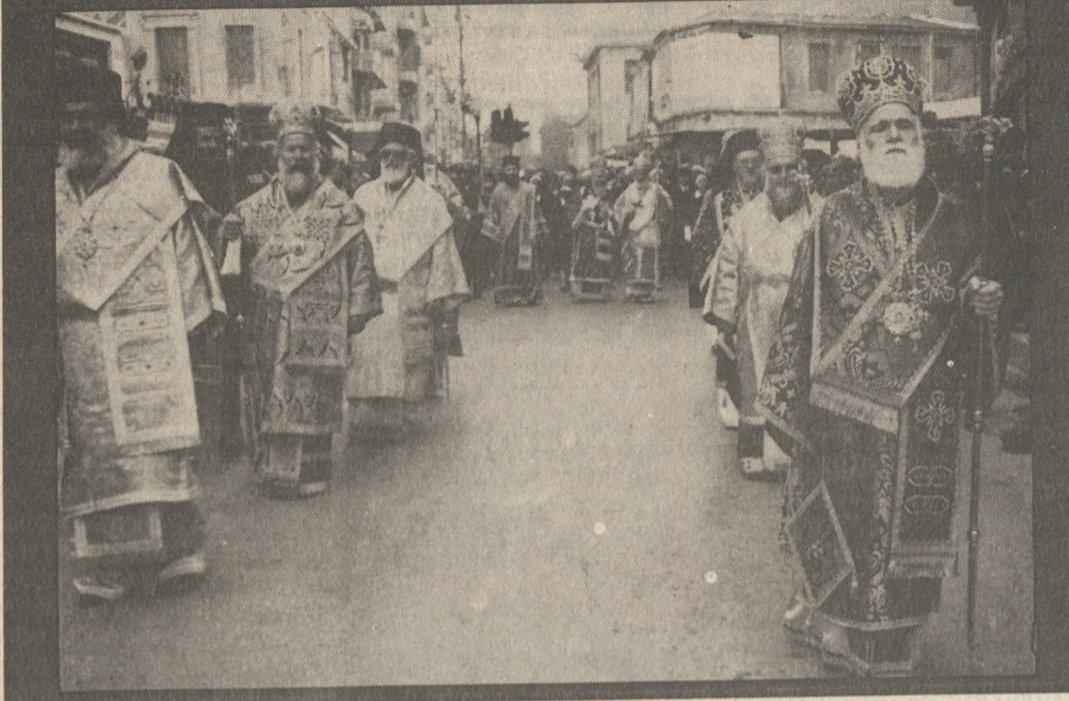
Οι Αρχιερείς την ώρα της λιτανείας. Άλλοι φέρον μήτρα και ποιμαντορική Ράβδο και άλλοι μόνο επανωκαλύμματα και εγκόλπιο.

«Η ΠΟΛΗΣ Ηρακλείου αγαθά και χάρει, Σε πολιτικούς οσχούς Μηνά θαυματοβότρα». Με επιστημονικά και βυζαντινά μεγαλοπρέπεια, αλλά και σε ατιμόσηλα θρησκευτικά κατόνυξ, το Μεγάλο Κάστρο γύρτασε την μνήμη του πολιούχου και προστάτη του Αγίου Μηνά του Θαυματουργού. Στον πανηγύριον περικαλή ναό έγινε Πατριαρχική θεία Λειτουργία, με συμμετοχή και δέκα Αρχιερέων. Μετά την θεία Λειτουργία έγινε λιτάνευση της σεπτής Εικόνας και του Ιερού Λειψάνου του Αγίου στους κεντρικούς δρόμους της πόλης μας. Στην εορτή είναι αφιερωμένο το σημερινό «Περίσκοπιο».