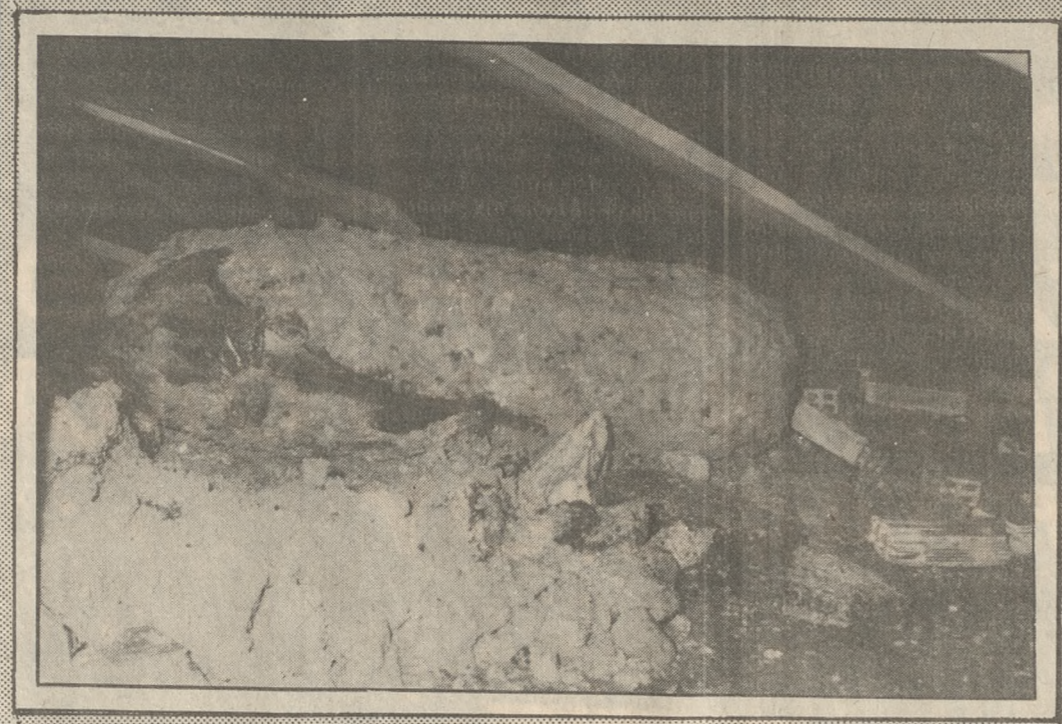
Βλήμα που κατά πάσα πιθανότητα χρονολογείται από τα κατακτικά χρόνια δρέθηκε χθες από εργάτες του συνεργείου της ΔΕΥΑΗ, που έκοζαν στην οδό Σκορδύλων, στην Αγία Τριάδα. Το βλήμα που ίσως θα μεταφερθεί σήμερα σε στρατιωτική μονάδα για να εξοκριθεί τι τύπος ακριβώς είναι, κι αν βρίσκεται σε ενέργεια ακόμη ή όχι, ήταν θαμμένο σε βάθος περίπου 50 εκατοστών.