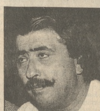
Ο κ. Χατζηνάκης

Η εκπροσώπηση της Κρήτης στη νέα Κυβέρνηση είναι σημαντική δεδομένου ότι στην μετέχουν οι: Μανόλης Παπαστεφανάκης ως αναπληρωτής υπουργός ΠΕΧΩΔΕ, Μαρία Κυπριωτάκη υφυπουργός Προεδρίας, Νίκος Σκουλάς αναπληρωτής υφυπουργός Εθνικής Οικονομίας, Μανόλης Σκουλάκης υφυπουργός Υγείας Προνοίας, Μανόλης Χατζηνάκης υφυπουργός Πολιτισμού, και Σήφης Βαθυράκης υφυπουργός Δημόσιας Τάξης.