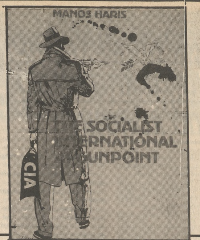
«Η ΣΟΣΙΑΛΙΣΤΙΚΗ ΔΙΕΘΝΗΣ ΣΤΟ ΣΤΟΧΑΣΤΡΟ ΤΗΣ CIA»