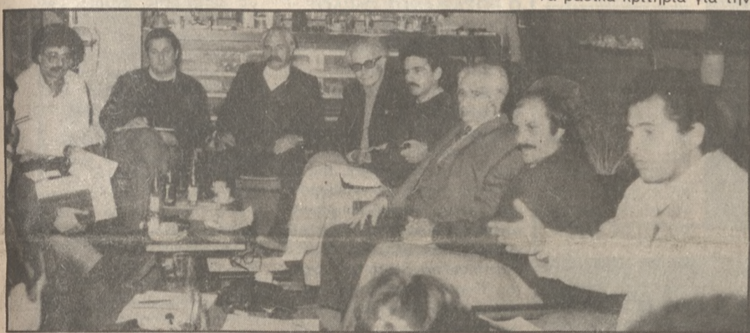
Εκπρόσωποι της κίνησης στη χθεσινή συνέντευξη τύπου ΦΩΤΟ Ν. ΜΑΛΤΕΖΑΚΗΣ τηλ. 238739