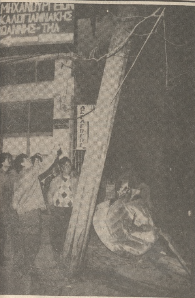
ΦΩΤΟ Ν. ΜΑΛΤΕΖΑΚΗΣ ΤΗΛ. 238739