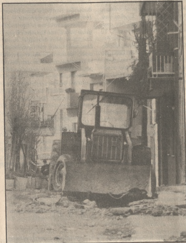
ΦΩΤΟ Ν. ΜΑΛΤΕΖΑΚΗΣ Τηλ. 238739

ΤΗΛ. Τηλεφ. Κέντρο 258.079 (Σύνταξη) 258.082 Διαχειρίσεως 282.625 Τελεfax: 258.161