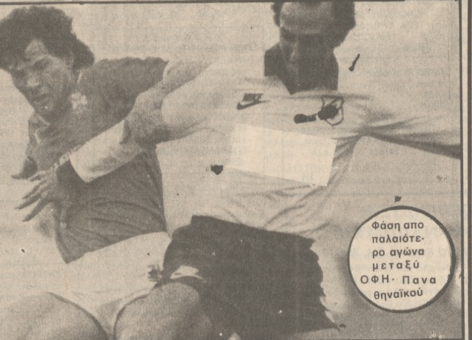
Φάση από παλαιότερο αγώνα ΟΦΗ - Παναθηναϊκού

ΤΕΛΟΣ για τα μεταγραφικά είπε και τα εξής: * Δεν ξέρω αν θα έλθει στον ΟΦΗ ο «φονιάς», αφού δεν τον ζητήσα. Ο Παναθηναϊκός δεν μας έχει ζητήσει παίκτες, αλλά μόνο το Ρέθυμνο.