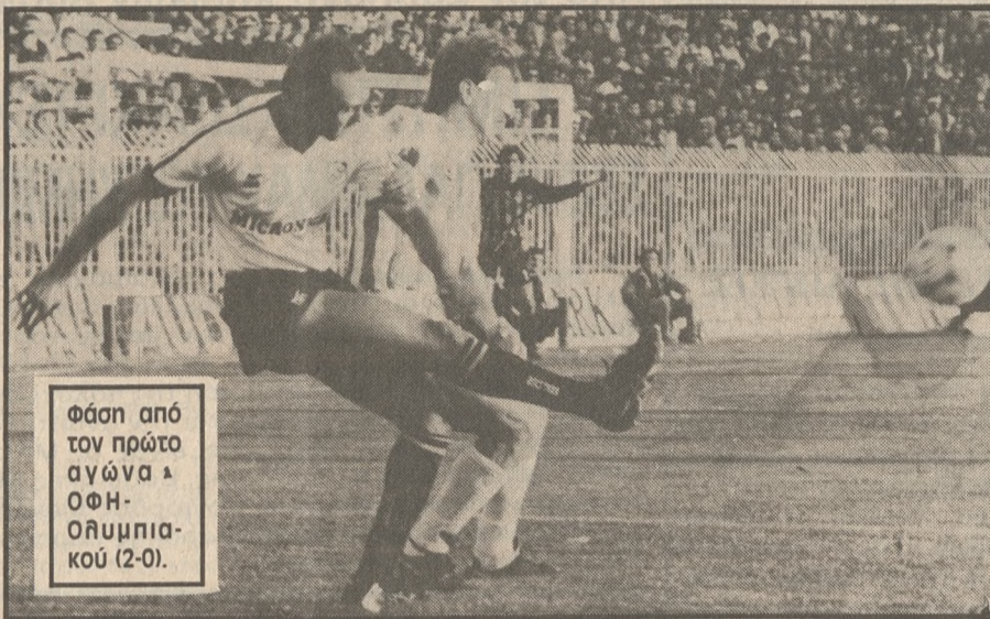
Φάση από τον πρώτο αγώνα ΟΦΗ-Ολυμπιακού (2-0).

ΜΕ πολλές ελλείψεις ο ΟΦΗ αγωνίζεται σήμερα στο Ολυμπιακό Στάδιο της Αθήνας με τον Ολυμπιακό Πειραιά, για το Κύπελλο Ελλάδας, αλλά με στόχο να πάρει την πρόκριση. Πρόκειται για τον επανληπτικό αγώνα της β' φάσης του Κυπέλλου. Στον πρώτο αγώνα που είχε γίνει πριν δεκαπέντε μέρες στο Ηράκλειο ο ΟΦΗ είχε κερδίσει με 2-0. Αυτό σημαίνει ότι το Ηρακλειώτικο συγκρότημα για να εξασφαλίσει την πρόκριση θα πρέπει να εξασφαλίσει διαφορά καλύτερη του 2-0. Ούτε λόγος βέβαια ότι ο ΟΦΗ περνάει με νίκη και με ισοπαλία. Σημαντικό ρόλο θα παίζει το αν ο ΟΦΗ σημειώσει ένα γκολ, γιατί τότε ο Ολυμπιακός θα χρειαστεί τέσσερα για να περάσει. Αν δηλαδή το σκορ είναι 3-1 υπέρ του Ολυμπιακού τότε ο ΟΦΗ θα είναι αυτός που θα εξασφαλίσει το εισιτήριο της πρόκρισης. Φυσικά αν στον κανονικό αγώνα καλυφθεί το 2-0 για τον Ολυμπιακό, τότε, θα έχουμε παράταση και αν παραμείνει τότε θα κτητηθούν πέναλτυ.