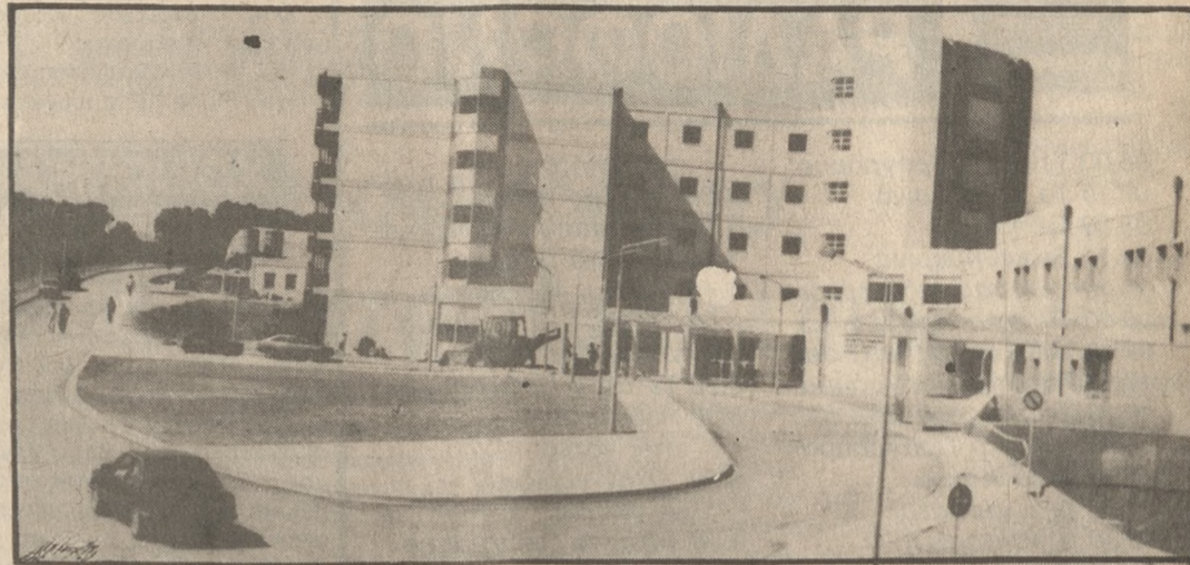
Νέα αναβολή στη λειτουργία του Πανεπιστημιακού νοσοκομείου. Πάντως θα λειτουργήσει πριν τις εκλογές...