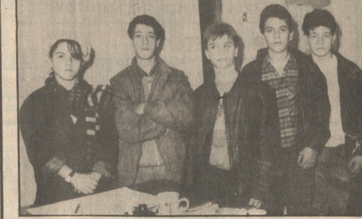
Αντιπροσωπεία των απεργών μαθητών χθες στα γραφεία της «Π»

«Π» μας ανέφερε ότι πολλές φορές έχουν ενημερώσει τον Γυμνασιάρχη, ζητώντας να βελτιωθούν οι απαράδεκτες αυτές συνθήκες. Ο ΣΥΛΛΟΓΟΣ ΓΟΝΕΩΝ ΓΙΑ ΤΗΝ ΑΠΕΡΓΙΑ ΤΩΝ ΔΑΣΚΑΛΩΝ Στον αγώνα των δασκάλων και νηπιαγωγών, που γίνεται σε μια περίοδο δέσμησης των προβλημάτων της Παιδείας συμπα-