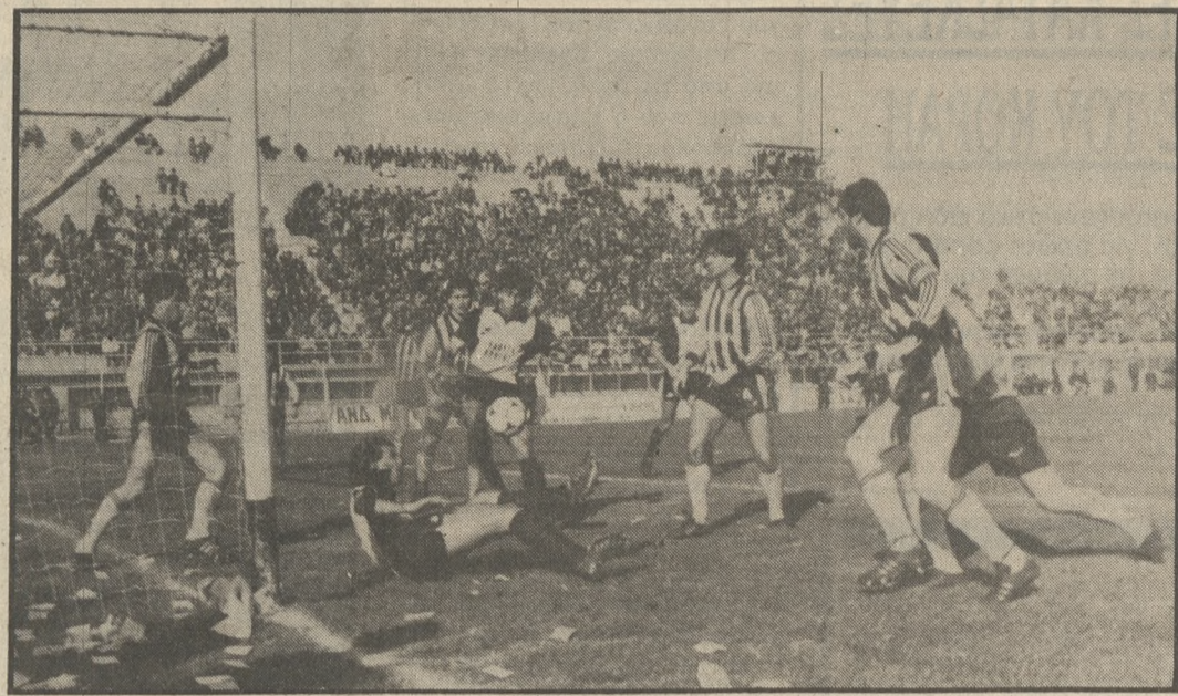
Φάση από τον περυσινό αγώνα του Ο.Φ.Η. με τον Άρη.

Τελευταία Κυριακή σήμερα για το 1988, αφού το πρωτάθλημα διακόπτεται και θα ξαναρχίσει στις 8 Ιανουαρίου 1989, και ο ΟΦΗ αγωνίζεται εντός με τον Άρη Θεσσαλίας.