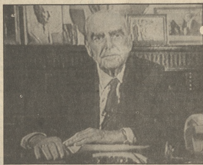
Θα μείνω στις επάλξεις δήλωσε χθες ο Πρωθυπουργός.

επίσης, ότι ο τόπος διέρχεται με βαθεία πολιτική και κοινωνική κρίση, που έχει δύο σκέλη. Το πρώτο σκέλος αφορά στην καθαρή και αντιμετωπίζεται τόσο μέσω της τακτικής δικαιοσύνης όσο και μέσω της εξεταστικής επιτροπής της βουλής. Το δεύτερο σκέλος, συμπλήρωσε ο Πρωθυπουργός αφορά στη χυδαίοτητα των οκτώστων πολλών εφημερίδων, που με ψευδολογήματα ως στόχο έχουν την σπύλωση της τιμής του πολιτικού κόσμου και τελικά την υπονόμευση των δημοκρατικών θεσμών.