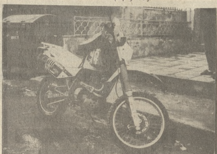
Η «ύποπτη» μηχανή.

Ερευνείται το ενδεχόμενο να έχει χρησιμοποιηθεί από τους δράστες στη διαδικασία της διαφυγής τους.