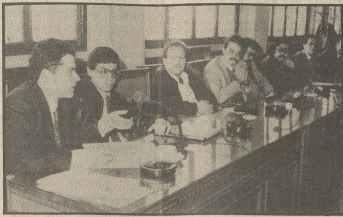
Άποψη από τη χθεσινή ημερίδα.

πρέπει να τοποθετηθεί το Αιολικό Πάρκο», «Τι μέγεθος είναι σκόπιμο να γίνει», «Ποια πρέπει να είναι η διαδικασία επιλογής των ανεμογεννητριών», «Πως πρέπει να τοποθετηθεί στο χώρο που επιλέχτηκε».