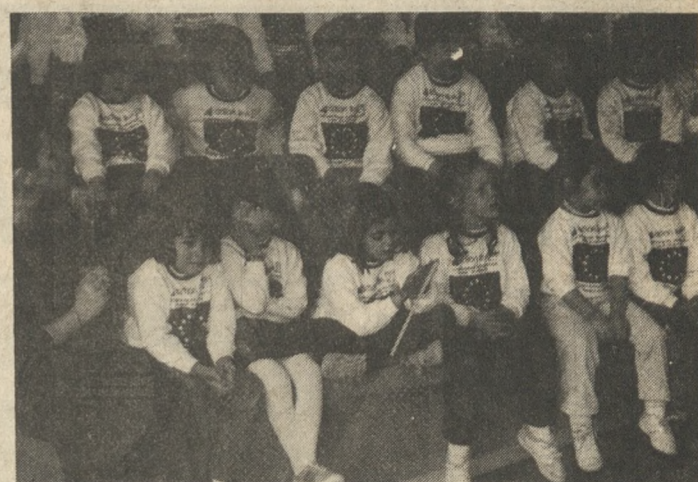
Τα παιδιά του «Παγκρητίου» κατά την εκδήλωση.

Σχημάτισαν με πολύχρωμα ξυλάκια τις σημαίες των 12, τραγούδιαν ανεμίζοντας τα μπλε σημαϊάκια με τα 12 αστέρια το τραγούδι της ενότητας των λαών, παρακολούθησαν κουκλοθέατρο με κουκλάκια που φορώντας τα χρώματα της