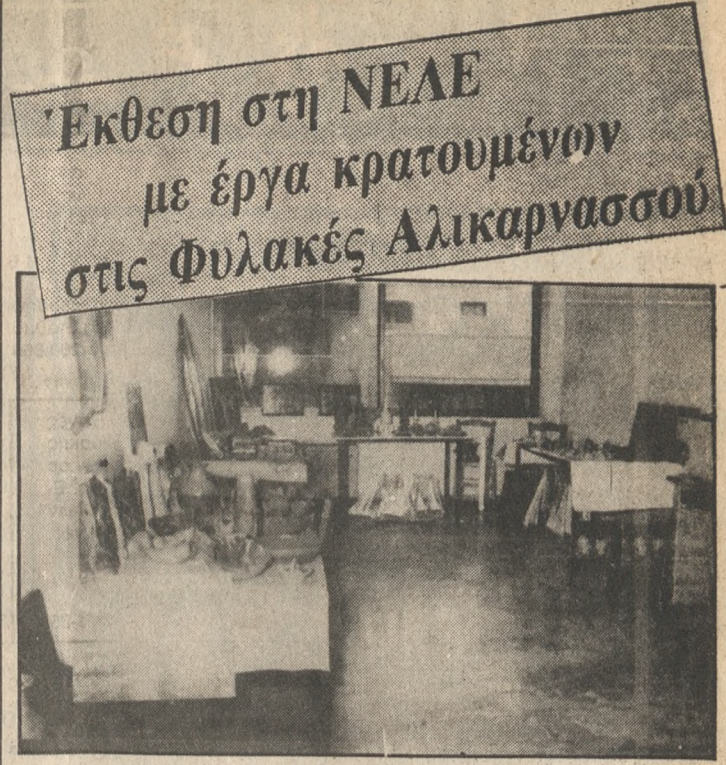
Έκθεση με κεραμικά, ξυλόγλυπτα, εικόνες και κρηπήςγια, φτιαγμένα από τους κρατούμενους στις φυλακές της Αλικαρνασού, λειτουργεί στα γραφεία της ΝΕΛΕ Ηρακλείου (Ζωγράφου 8, 2ος όροφος).