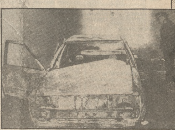
Πρώτος στόχος των δραστών ήταν η εξασφάλιση κάθε ίχνους που ενδεχόμενα θα οδηγούσε στη σύλληψή τους. Αν ήταν ξένοι τι θα είχαν να φοβηθούν;

τητα-διαβατήριο-άδεια οδηγίας) έχει ξεκινήσει σύμφωνα με πληροφορίες της «Π» από διετία περίπου, γεγονός που μαρτυρά τον σχεδιασμό της επιχείρησης (ενδεχόμενα όχι ίσως της συγκεκριμένης).