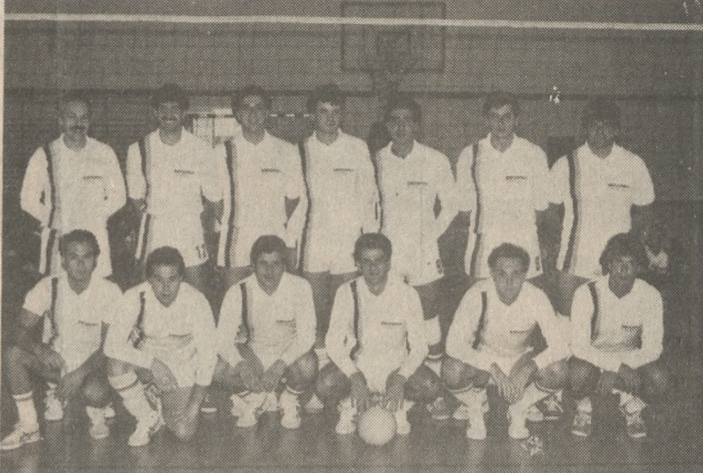
Η ομάδα βόλεϊ της Εμπορικής Τράπεζας.