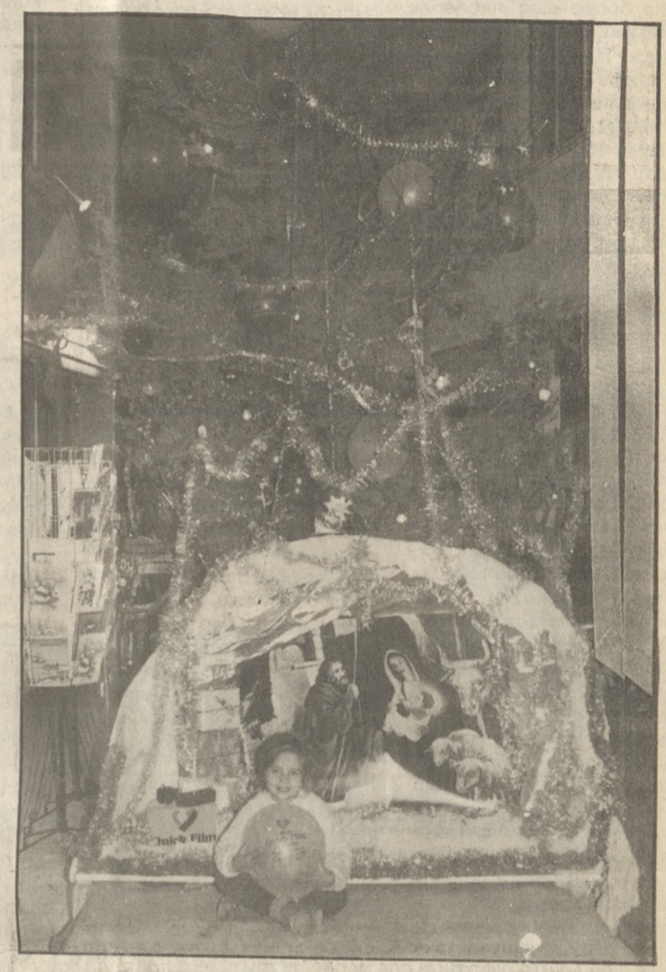
Πρωτότυπη ιδέα του QUICK FILM