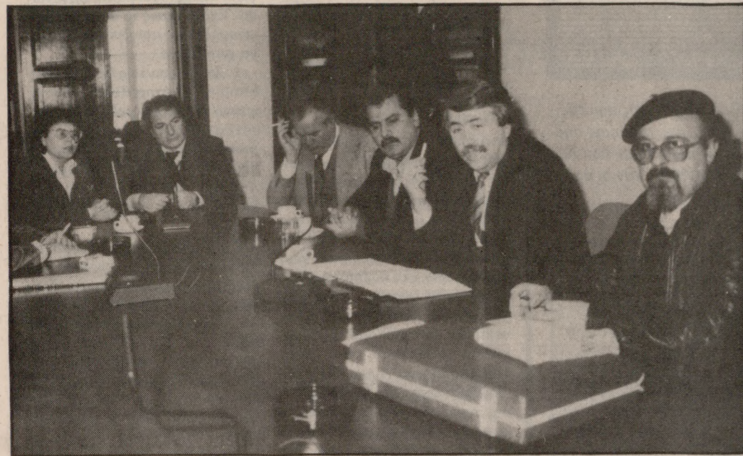
Στιγμιότυπο από τη χθεσινή σύσκεψη στην περιφέρεια

ΙΔΡΥΕΤΑΙ ΚΕΝΤΡΟ ΥΠΟΔΟΧΗΣ ΑΠΟΦΥΛΑΚΙΖΟΜΕΝΩΝ