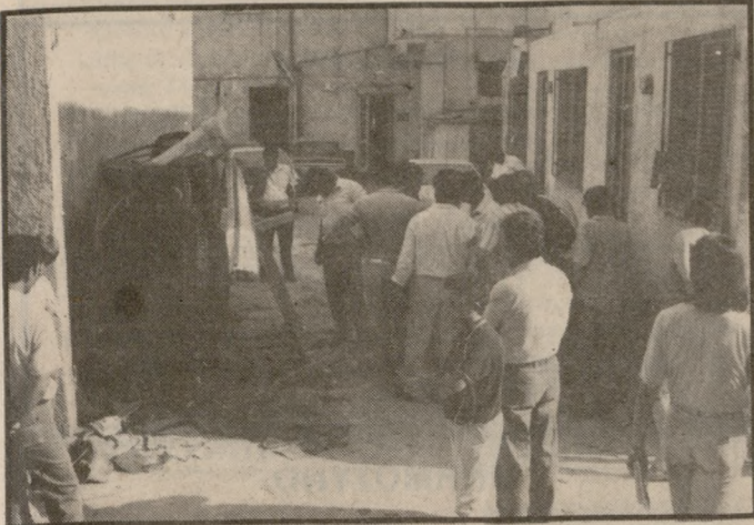
Βόμβα-πρόκληση στο τμήμα ασφαλείας Ηρακλείου καταστρέφοντάς 3 αυτοκίνητα.