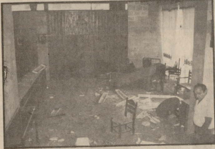
Από την βομβιστική επίθεση στα Γραφεία του ΕΟΤ Κρήτης.