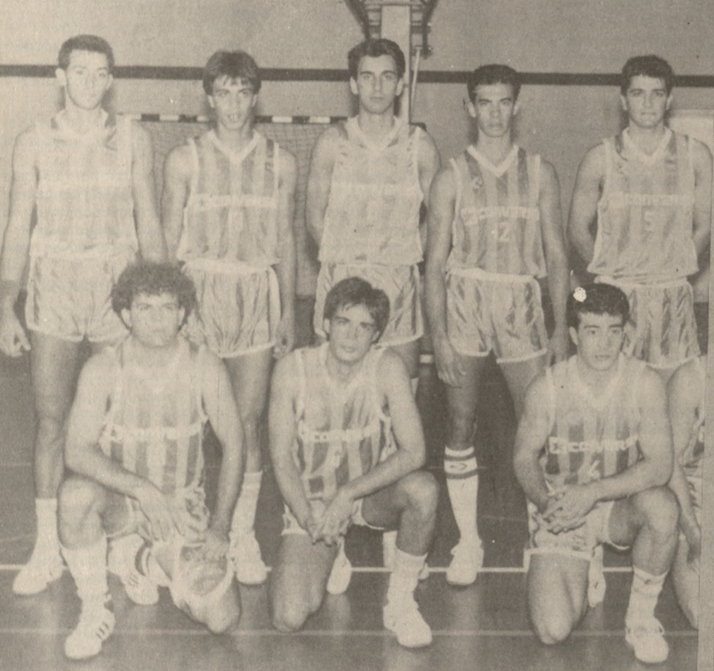
Η ομάδα της ΓΕΗ, η οποία δίνει σήμερα ένα δύσκολο και κρίσιμο βαθμολογικό αγώνα. Αυτό σημαίνει ότι οι φίλοι του μπάσκετ πρέπει να θρουν σήμερα στο ημευρό της.

Οι ομάδες του Ηρακλείου που αγωνίζονται στο πρωτάθλημα μπάσκετ Γ' Εθνικής δίνουν κρίσιμους βαθμολογικά αγώνες. Στην Α' Εθνική Γυναικών η ΓΕΗ έχει κάνει πλέον τυπική την παρουσία της. Για τα πρωταθλήματα Κρήτης θα γίνουν αγώνες Γυναικών, Εφήβων και Παίδων. Να δούμε αναλυτικά τα προγράμματα για το Σαββατοκύριακο.