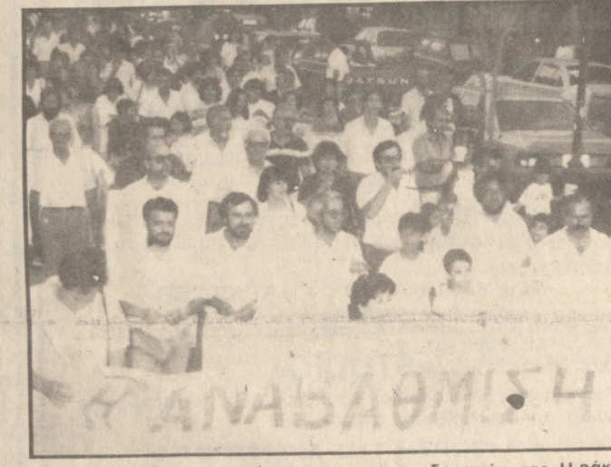
Απο προηγούμενη συγκέντρωση των εκπαιδευτικών στο Ηράκλειο

Την εισήγηση της προς τις γενικές συνελεύσεις των κατά τόπους Ενώσεων των καθηγητών (ΕΛΜΕ), έστειλε σήμερα το Δ.Σ. της Ομοσπονδίας (ΟΛΜΕ). Επίσης επέστειλε και το πρόγραμμα δράσης του κλάδου, με το οποίο προσδιορίζονται ημερομηνίες απεργιών. Ειδικότερα, το Δ.Σ. της ΟΛΜΕ προτείνει τριήμερη απεργιακή κινητοποίηση για τις 21, 22, 23 Φεβρουαρίου, γενικές συνελεύσεις των ΕΛΜΕ στις 24 Φεβρουαρίου και γενική συνέλευση προέδρων στις 26 Φεβρουαρίου «Για παραπέρα κλιμάκωση των απεργιακών και άλλων κινητοποιήσεων του κλάδου». Το Δ.Σ. της ΟΛΜΕ επισημαίνει μεταξύ άλλων στην εισήγηση της προς τις ΕΛΜΕ: «Τώρα είναι ευνοϊκή εποχή να έχουμε κατακτήσει στα αιτήματά μας. Τώρα πριν τις εκλογές, που όλοι, κυβέρνηση και κόμματα ζητούν ένα φιλολαϊκό πρόσωπο μπροστά στις εκλογές μπορούμε με μαζικούς αποφασιστικούς αγώνες να κερδίσουμε. Τώρα θα καλέσουμε όλους τους πολιτικούς σχηματισμούς, και πρώτα από όλους βέβαια την κυβέρνηση να αποδέχονται πόσο κοντά θα βρίσκονται οι προεκλογικοί τους λόγοι με τα έργα τους». Τα αιτήματα των οποίων την λύση διεκδικεί η ΟΛΜΕ είναι μεταξύ άλλων: Κατώτατες αποδοχές 105.000 δρχ. και αναλογική αύξηση των άλλων κλιμάκων. Ενσωμάτωση του επιδόματος εξο-