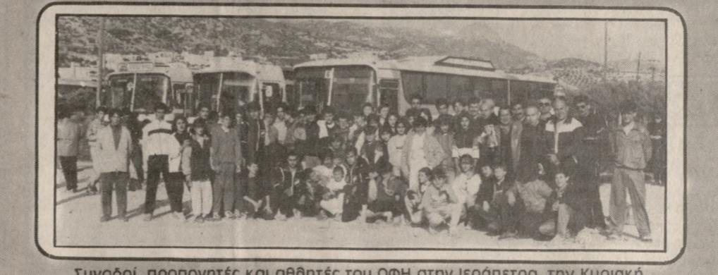
Συνοδός, προπονητές και αθλητές του ΟΦΗ στην Ιεράπετρα, την Κυριακή.