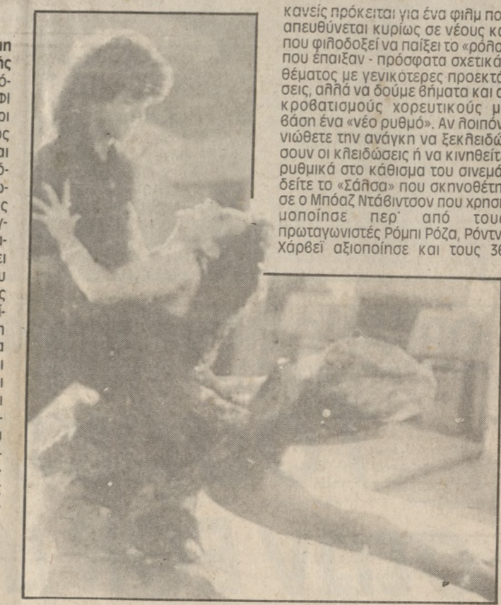
Σκηνή από την ταινία «ΣΑΛΣΑ»

«Νέτερι ντάνιν» και «Μπρέκνταν» και ως θεαμάτα διεθνούς καριέρας, αλλά και ως ρυθμίοι που κατέκτησαν κάποια στιγμή τη νεολαία. Βέβαια για να γίνει κάτι τέτοιο, κι αυτή η ταινία έχει κάποιο «προσοχή μύθος», ώστε να μη μένει σαν μια... επιδίωξη από φιγούρες, που η μία - λιγότερο ή περισσότερο θεαματική από την άλλη - οδηγεί στην άλλη. Ετσι έχουμε για μια ακόμα φορά μικρορωτικές μικροσυνθέσεις, μικροσυνθέσεις, μικροσυνθέσεις. Όπως ασφαλίσει καταθαίνει ο αναγκαστής, όλα τούτα είναι οι σε «Πήματα επαριστοποίησης», αφού σκόπευε δεν είναι ο προβληματισμός ή η προσαφή ενός κάποιου (ΑΣΤΟΡΙΑ)