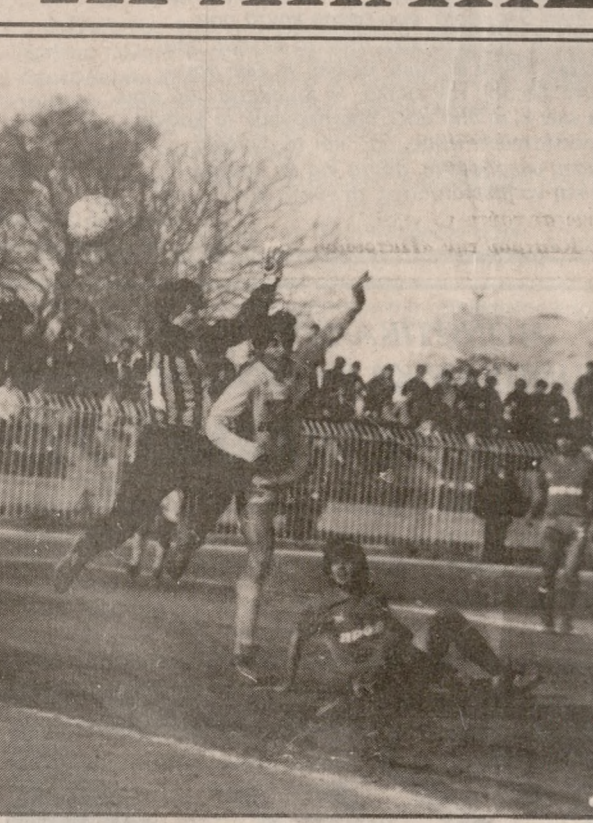
Ο Χριστοδούλου προλαμβάνει την έξοδο του τερματοφύλακα και με κεφαλιά στέλνει την μπάλα στα δίχτυα του Μεσολογγίου.