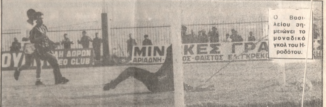
Ο Βασίλειος σημειώνει το μοναδικό γκολ του Ηρόδοτου.