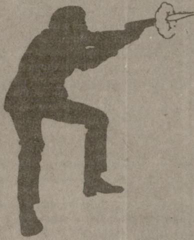
ευθύνη της επίθεσης κατά του προέδρου της ΓΣΕΕ Γιώργου Ραυτοπούλου. Ο νεκρός εισαγγελέας σύμφωνα με χθεσινοβράδυνες πληροφορίες κατείχε την εισαγγελική έδρα στην υπόθεση έκδοσης του Μασουρίτσιο Φολίνι τον οποίο εκζητούσαν οι Ιταλικές Δικαστικές Αρχές. Ο Βενάρδος είχε προτείνει τότε να εκδοθεί ο Φολίνι υποστηρίζοντας ότι τα εγκλήματα για τα οποία κατηγορείται δεν ήταν πολιτικά. Ο ίδιος επίσης είχε αναλάβει την υπόθεση αναψιλάφησης της Άννας Τσάμπαν.

Ο Βενάρδος ήταν παντρεμένος και είχε τρία παιδιά, δύο κορίτσια 22 και 23 αντίστοιχα και ένα αγοράκι 14 ετών. Σύμφωνα με καταθέσεις αυτόπτων μαρτύρων δύο νεαροί περιμένον στην περιοχή απ' όπου θα περνούσε ο Αντεισαγγελέας περίπου 20 λεπτά. Ο ένας απ' αυτούς ήταν πάνω στην μοτοσυκλέτα και ο άλλος έκοβε βόλτες. Μόλις ο τελευταίος πυροβόλησε τον Αντεισαγγελέα ανέβηκε στη μηχανή και μαζί με τον άλλο εξαφανίστηκαν. Στον τόπο του εγκλήματος λίγα λεπτά αργότερα αστυνομικός περιπολικός βρήκε την προκήρυξη με την οποία οργάνωση «1η ΜΑΗ» αναλάμβανε την ευθύνη.