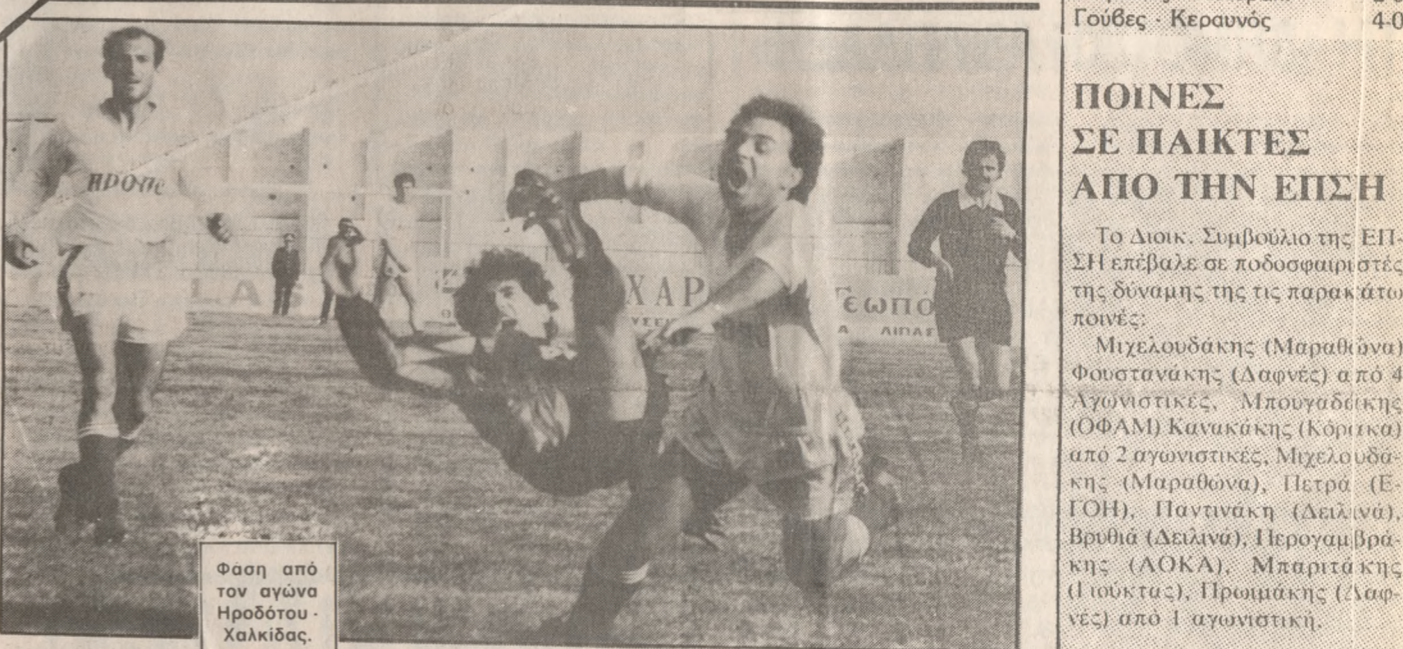
Φασή από τον αγώνα Ηρόδοτος - Χαλκίδα.