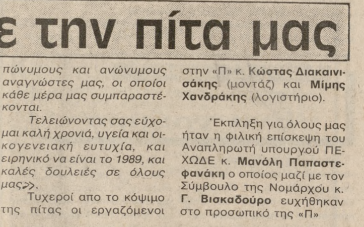
ΣΤΙΓΜΙΟΤΥΠΑ ΑΠΟ ΤΗΝ ΚΟΠΗ ΤΗΣ ΠΙΤΑΣ ΤΗΣ «Π»

Τυχεροί από το κόμμο της πίτας οι εργαζόμενοι