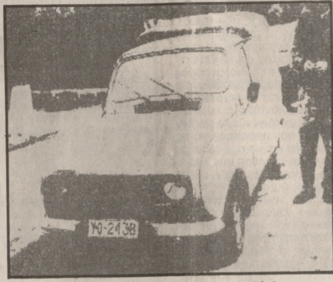
Το αυτοκίνητο της χρηματοποστολής που δέχθηκε την επίθεση των ληστών.