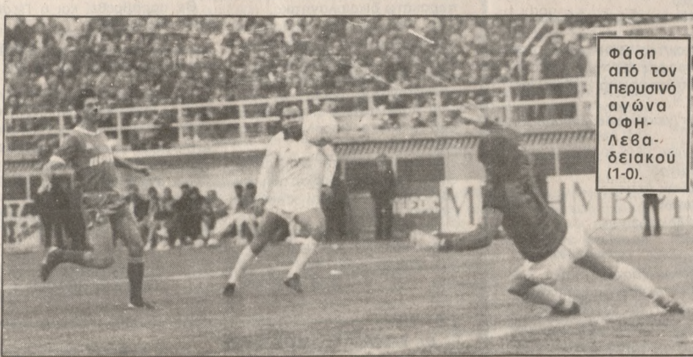
Φάση από τον περσινό αγώνα ΟΦΗ-Λεβαδειάκου (1-0).