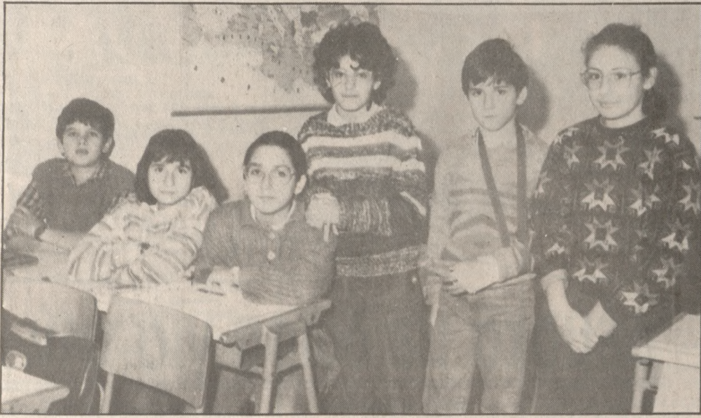
Μαθητές του 35ου Δημοτικού Σχολείου

Τα αφοδευτήρια είναι ακριβώς δίπλα στις αίθουσες διδασκαλίας και καταλαβαίνετε ότι έτσι δημιουργείται κίνδυνος για την υγεία μας. Το σχολείο δεν έχει αυτή με αποτέλεσμα τα παιδιά την ώρα του διαλείμματος να πηδούν στον δρόμο με τον φόβο των ατυχημάτων από τα διερχόμενα αυτοκίνητα. Επίσης κανείς γυμναστής δεν έρχεται στο σχολείο μας αφού δεν υπάρχει χώρος για το μάθημα αυτό. Και αναρωτιόμαστε εμείς οι μαθητές του 35ου. Πώς θα βγούμε αύριο στην κοινωνία μέσα από αυτά τα μπουντρούμια; Ειδικά οι μαθητές της έκτης τάξης δεν έ-