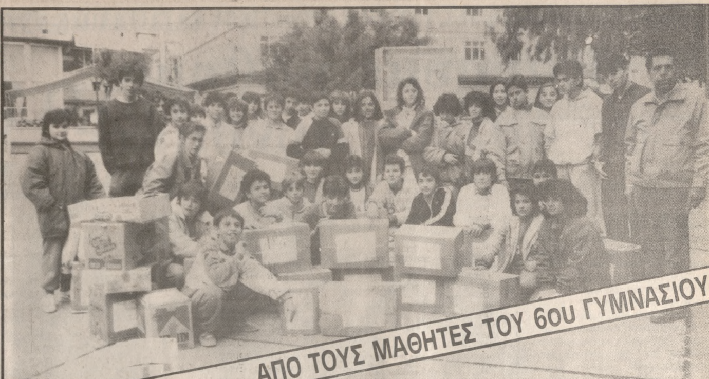
ΑΠΟ ΤΟΥΣ ΜΑΘΗΤΕΣ ΤΟΥ 6ΟΥ ΓΥΜΝΑΣΙΟΥ

τικάν στο έγγραφο αυτό περιλαμβάνονται συγκεκριμένες υλοποιήσιμες προτάσεις, που θα συνέβαλαν στην κατεύθυνση της συντομότερης έναρξης λειτουργίας του Νοσοκομείου μας και θέλουμε να πιστεύουμε και το Ιατρικού Τμήματος. Είμαστε αποφασισμένοι να λάβουμε κάθε μέτρο που θα εξασφαλίσει την συντομότερη έναρξη λειτουργίας του Νοσοκομείου προς όφελος του Κρητικού λαού αλλά και για την κάλυψη των εκπαιδευτικών αναγκών».