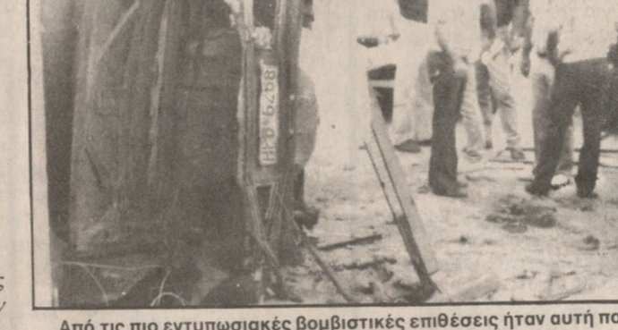
Από τις πιο εντυπωσιακές βομβιστικές επιθέσεις ήταν αυτή που έγινε στο προαύλιο του Τμήματος Ασφαλείας Ηρακλείου.

γεγονότα και κυρίως με την ανυπόληστη έξαρση των βομβιστικών επιθέσεων. Κυκλοι του υπουργείου Δημοσίας Τάξης εκτιμούν ότι τα γεγονότα αυτά στο χώρο του νομού Ηρακλείου αλλα και η αποτελεσματικότητα των δράσεων έχουν διαμορφώσει ένα «βαρύ κλίμα» αλλά και δικαιολογημένη ανασφάλεια στην Κοινή γνώμη για την οποία ζητείται εκτόνωση. Παράλληλα από τους ίδιους κύκλους του υπουργείου προβάλλεται η