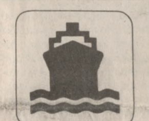
ΠΡΟΚΕΙΤΑΙ για το επτακάτοξο οχηματογάτο «Ανεμος» της εταιρείας «Υτών Α.

ΝΕΑ ακτοπλοϊκή γραμμή Θεσσαλονίκη-Ηράκλειο πρόκειται να εγκατασταθεί στα πλαίσια της ανανέωσης του συμβατικού ακτοπλοϊκού στόλου. ΠΙΟ συγκεκριμένα δημιουργήθηκε ήδη η ακτοπλοϊκή γραμμή Θεσσαλονίκης-Βορείων Σποράδων-Κυκλάδων-Ηρακλείου. Θα εκτελείται από ένα σχετικά καινούριο σκάφος - 13 χρόνων - που υπόκειται στις αναγκαίες τροποποιήσεις για το σκοπό αυτό.