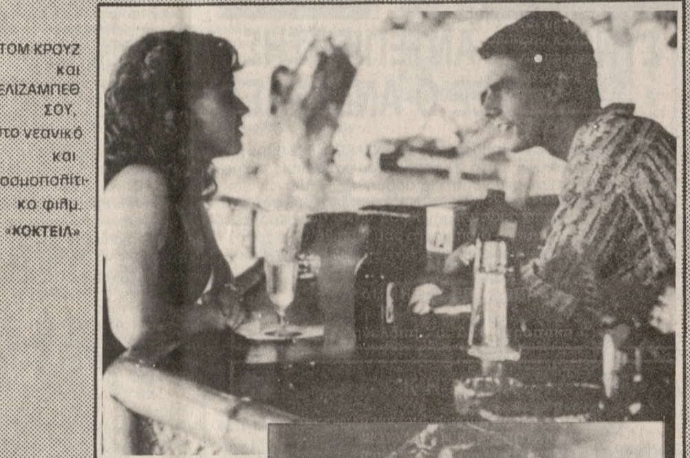
ΤΟΜ ΚΡΟΥΖ ΚΑΙ ΕΙΖΑΜΠΕΘ ΣΟΥ. ΣΤΟ ΝΕΑΝΙΚΟ ΚΑΙ ΚΟΣΜΟΠΟΛΙΤΙΚΟ ΦΙΛΜ «ΚΟΚΤΕΙΛ»

«ΚΟΚΤΕΙΛ» Περίπετα έγχρωμη Αμερικ. παραγωγή ΜΙΑ ακόμη ταινία για νέους, με πρωταγωνιστές νέους σε πλαίσιο νεανικό και κοσμοπολίτικο, που ανάλαβάν των Κανών. Ο Γουίλλουμ είναι ένας ασφαλές μέρος. Βέβαια, ο Τζορτζ Λούκας σπατάλησε αρκετά χρήματα για να φτιάξει μια όσο το δυνατό πιο πλούσια παραγωγή, με εντυπωσιακά ειδικά εφέ και μπλόκη και ποικιλία