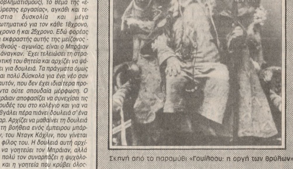
Σκηνή από το παραμύθι «Γουίλλουμ: η οργή των θρύλων».

φρα αντιμετωπίζει (χωρίς βέβαια προβληματισμούς), το θέμα της «εξουσίας εργασίας», αγκάθι και τεράστια δυσκολία για τον κάθε 18χρονο, 20χρονο ή και 25χρονο. Εδώ φορές και εκφραστής αυτής της μεζόζου - διεθνούς - αγωνίας, είναι ο Μπράιαν Φλάναγκαν. Έχει τελειώσει τη στρατιωτική του θητεία και αρχίζει να ψάχνει για δουλειά. Τα πράγματα όμως είναι πολύ δύσκολα για ένα νέο σαν κι αυτόν, που δεν έχει ιδιαίτερα προσόντα ούτε σπουδαία μόρφωση. Ο Μπράιαν αποφασίζει να συνεχίσει τις σπουδές του στο κολέγιο και για να τα βγάλει πέρα πίνει δουλειά σ' ένα μπαρ. Αρχίζει να μαθαίνει τη δουλειά με τη βοήθεια ενός εμπειρομαμπάρμαν, του Νταγκ Κόχιν, που γίνεται και φίλος του. Η δουλειά αυτή αρχίζει να γοητεύει τον Μπράιαν, αλλά πιο πολύ τον συναρπάζει η ψυχολογία και η νοητική που κρύβει ολοσχερώς ο κόσμος που κινείται γύρω από την έννοια «μπαρ».