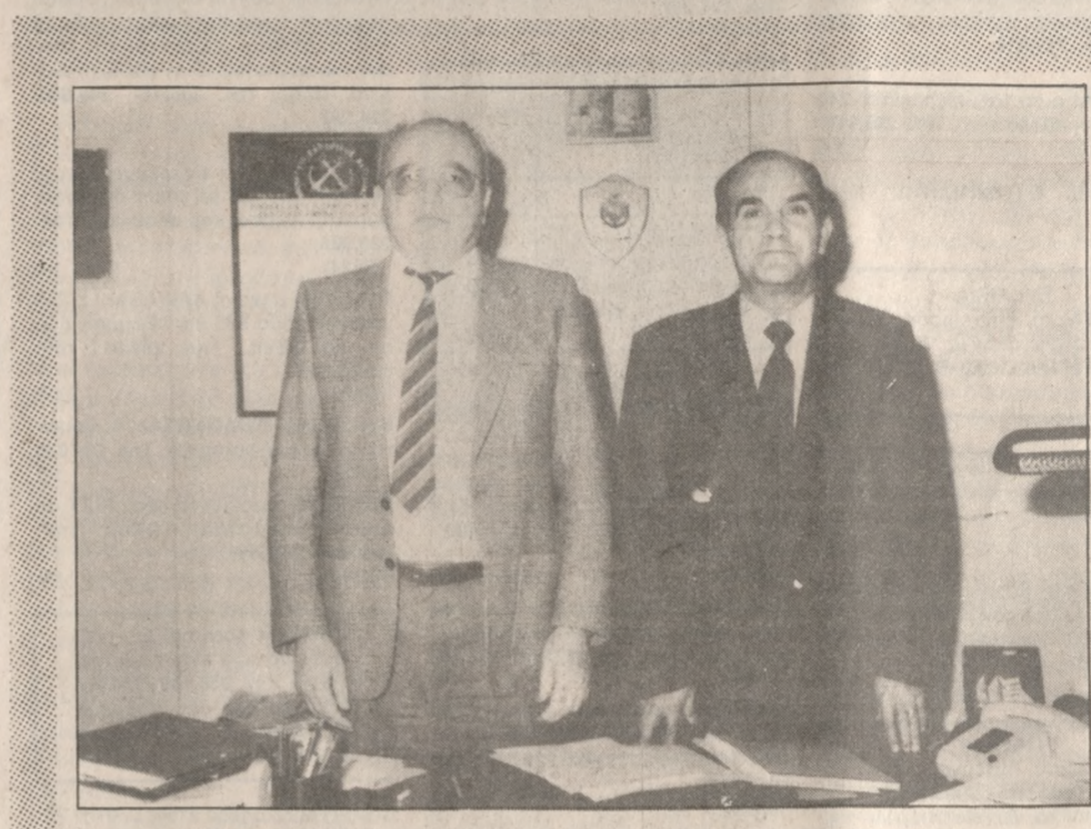
Ο απερχόμενος (αριστερά) και ο νέος (δεξιά) Κεντρικός Λιμενάρχης Ηρακλείου.