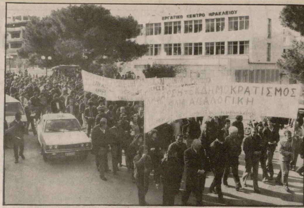
Από την συγκέντρωση και πορεία των εργαζομένων προχθές