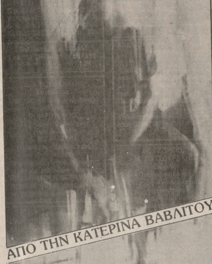
ΑΠΟ ΤΗΝ ΚΑΤΕΡΙΝΑ ΒΑΒΛΙΤΟΥ