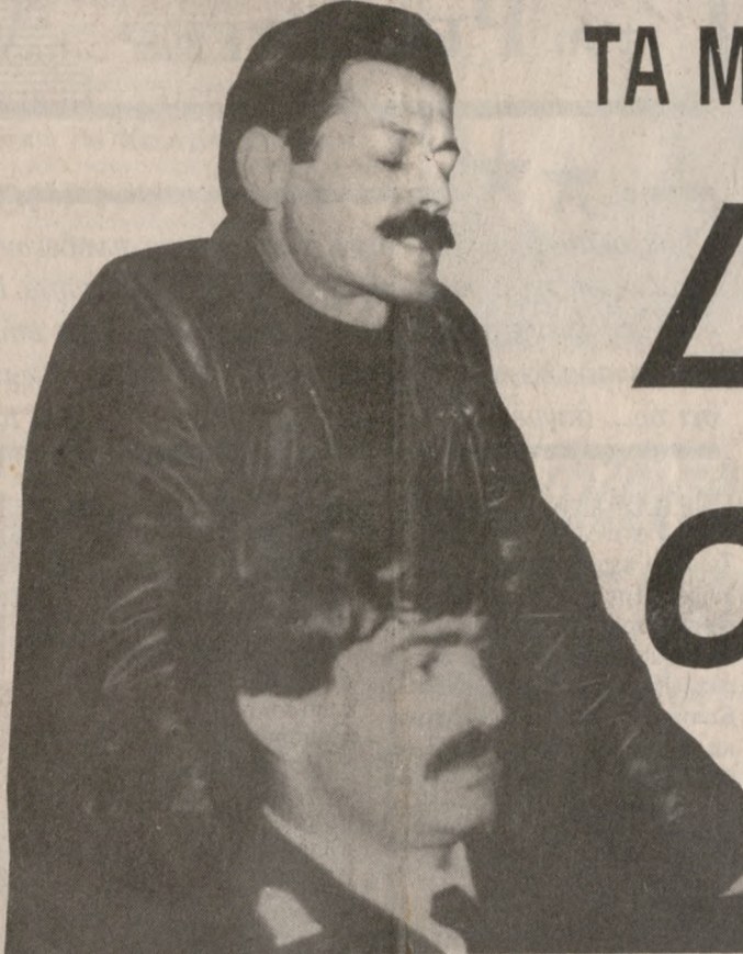
Ο δολοφόνος την ώρα που απολογείται για το διπλό έγκλημα στην διάρκεια της χθεσινής εκδίκασης της υπόθεσης στο Μικτό Ορκωτό Δικαστήριο Νεάπολης.

Ο Πρωθυπουργός έδωσε εντολές για την ταχύτερη αντιμετώπιση προβλημάτων που αφορούν τα λαϊκά συμφέροντα και ενέκρινε την πρόταση των προτεραιοτήτων