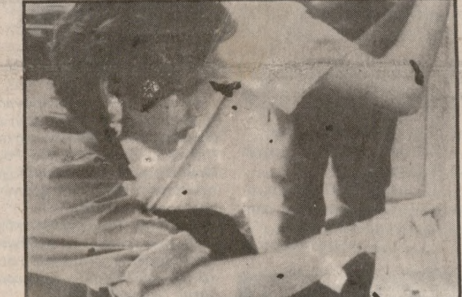
Μετά την αγνία για τα αποτελέσματα οι ενστάσεις από τους υποψήφιους.

Οι ενστάσεις που υποβλήθηκαν αφορούν κυρίως αθροιστικά λάθη των κομπιούτερς και αλλοιώσεις πινάκων σύμφωνα με τους οποίους πολλοί υποψήφιοι εμφανίζονται ως αποτυχόντες χθες το πρωί στην αίθουσα της