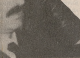
Ο δολοφόνος την ώρα που απολογείται για το διπλό έγκλημα στην διάρκεια της χθεσινής εκδίκασης της υπόθεσης στο Μικτό Ορκωτό Δικαστήριο Νεάπολης.

κη - τι άλλο θα μπορούσε να πει για έναν άνθρωπο που παραδέχεται ότι είναι εγκληματίας - αλλά το ότι κατέληξε στη διαπίστωση πως η δολοφονία του Κοινοτάχτη της Κασταμονίνας Κωστή Μανουσάκη και της αδελφής του Φωτεινής Μανουσάκη-Μπιτζάρη ήταν ένα οργανωμένο έγκλημα, που δεν είχε ερωτικά κίνητρα κι ότι ούτε ο Καρυωτάκης ήταν μόνος στην εκτέλεση του. Είχε συνεργούς.