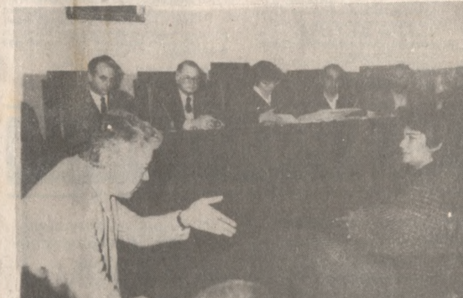
Η γυναίκα του δράστη καταθέτοντας χθες στο δικαστήριο.