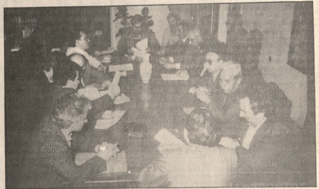
Η επιτροπή Μεταφορών του Νομαρχιακού Συμβουλίου στη χθεσινόβραδυνη συνεδρίασή της.