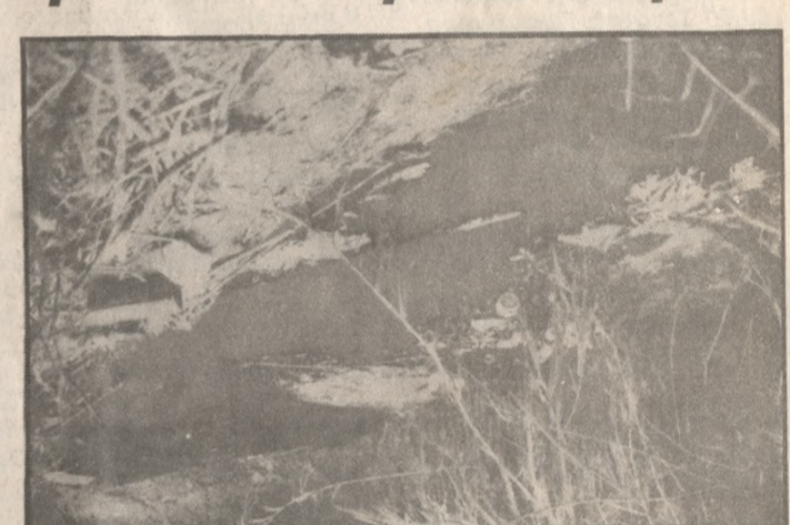
Το σημείο του Ξεροπόταμου όπου εμφανίστηκαν τα απόβλητα.

Η «Π» πήγε χθες στον Ξεροπόταμο και μίλησε με τους κατοίκους και οι οποίοι εξέφρασαν την ανησυχία τους για το φαινόμενο αυτό και έδειξαν αποφασισμέ-