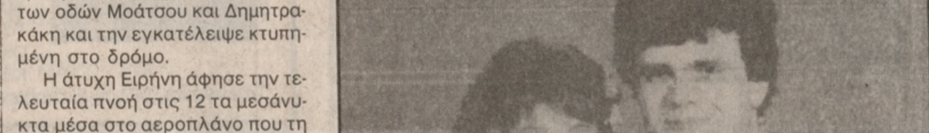
Η άτυχη Ειρήνη Λίτινα-Καλιτσουανάκη την ημέρα του γάμου της.

«ΒΟΗΘΕΙΑ ΒΟΗΘΕΙΑ!!» Αυτές ήταν οι λέξεις που άκουσαν ξαφνικά οι περαστικοί κλάματα δεπτερολέπτου. Μέχρι να κατεβεί από το αυτοκίνητο είχε συγκεντρωθεί κόσμος και αμέσως μεταφέρθηκε στο Νοσοκομείο.