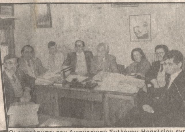
Οι εκπρόσωποι του Δικηγορικού Συλλόγου Ηρακλείου ενημερώθηκαν χθες τους δημοσιογράφους. ■ Ιδιαίτερα Γραφεία για τους Δικαστές δεν υπάρχουν παρά μόνο 5, στα δύο από τα οποία συνεχίζεται στη σελ. 5

Δίκαιο αλλά... Επίσημα και για πρώτη φορά αναγνωρίστηκε από την πολιτική ηγεσία του υπουργείου Δικαιοσύνης. Το δίκαιο του πολιτικού τμήματος της ίδρυσης στο Ηράκλειο έδρας του Μεταβατικού Εφετείου Κρήτης. Είναι χαρακτηριστικό ότι τόσο ο υπουργός Δικαιοσύνης όσο και ο Γενικός Γραμματέας στην πρόσφατη συνάντησή τους με την αντιπροσωπεία του Δικηγορικού Συλλόγου Ηρακλείου αναγνώρισαν ότι δεν υπάρχει λόγος για την μη ικανοποίηση των αιτημάτων. Δυστυχώς όμως από την πολιτική ηγεσία του υπουργείου Δικαιοσύνης το επιχείρημα της «προεκλογικής περιόδου» και της αναμόχλευσης των αντιδράσεων» για τη μη ικανοποίησή του. Και αυτό όταν αποδέχθηκαν ότι το αίτημα είναι δίκαιο! Οι εκπρόσωποι του Δικηγορικού Συλλόγου Ηρακλείου ενημερώθηκαν χθες τους δημοσιογράφους. ■ Ιδιαίτερα Γραφεία για τους Δικαστές δεν υπάρχουν παρά μόνο 5, στα δύο από τα οποία συνεχίζεται στη σελ. 5