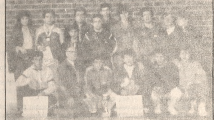
Αθλητές του Καλλέργειου Α.Ο. λίγο μετά τους αγώνες Β' Κατηγορίας Νότιας Ελλάδας.

● ΜΙΑ ακόμη επιτυχία πρόσθεσαν στο ενεργητικό τους οι παλαιστές του Καλλέργειου Α.Ο., οι οποίοι πήραν την πρώτη θέση στην βαθμολογία του πρωταθλήματος Ελληνορωμαϊκής Πάλης Ανδρών Β' Κατηγορίας Νότιας Ελλάδας. Ο Καλλέργειος συγκέντρωσε 49 βαθμούς, έναντι 32 του Εθνικού, ο οποίος κατέχει τα σκήπτρα στην Κα-