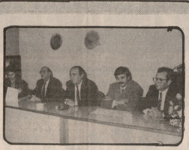
Από την χθεσινή συνέντευξη της «Αγροτικής Ζωής» για το έργο της

δα εντονότατα, για την εξορία της Κρήτης από τη σημερινή σύσκεψη στο Υπουργείο σας για θέματα παραεμπορίου και αυτό διότι όπως σας έχουμε τονίσει η Κρήτη είναι η περιοχή της Ελλάδας που πλήττεται από όλες τις