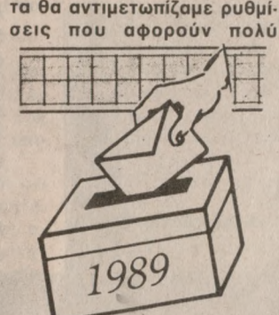
σημαντικά θέματα όπως: Την επιλογή σταυρού πρό- τήμησης ή λίστας.

άλλα ο υπουργός Εσωτερικών αναφέρει: Η κυβέρνηση με σαφήνεια διατύπωσε την πρόθεση της για ένα δίκαιο και αναλογικότερο εκλογικό σύστημα που θα στηρίζεται στις αρχές της απλής αναλογικής. Και είναι απορίας άξιο προοδευτικοί φορείς, που συμφωνούν σε αυτές τις αρχές να αρνούνται κάθε συζήτηση με την κυβέρνηση και την ίδια στιγμή να συζητούν με την ΝΔ που έχει εκφράσει την σαφή αντίθεση της σε αυτές. Υπενθυμίζουμε ότι στο διάλογο με τα κόμματα