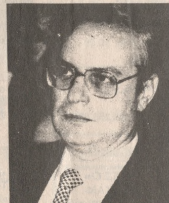
Ο Στάθης Γιώτας

Η πρώτη του ομιλία σε ανοικτή συγκέντρωση μετά την αποχώρησή του από το ΠΑΣΟΚ και την προχώρησή του στο συνασπισμό της Αριστεράς, θα απευθύνει σήμερα στο Ηράκλειο ο Στάθης Γιώτας. Ο τέως υπουργός και μέλος της προσωρινής Πολιτικής Επιτροπής του Συνασπισμού θα μιλήσει στις 5.30' το απόγευμα σε πολιτική συγκέντρωση στον Κιν/φο «Αστόρια» για τις πολιτικές εξελίξεις και το ρόλο του συνασπισμού σ' αυτές. Η ομιλία του κ. Στάθης Γιώτα αναμένεται με ιδιαίτερο ενδιαφέρον από τους πολιτικούς παρατηρητές καθώς σ' αυτήν ο πρώην υπουργός του ΠΑΣΟΚ και κορυφαίο κομματικό στέλεχος μέχρι πρό τινας του κυβερνητικού Κόμματος: