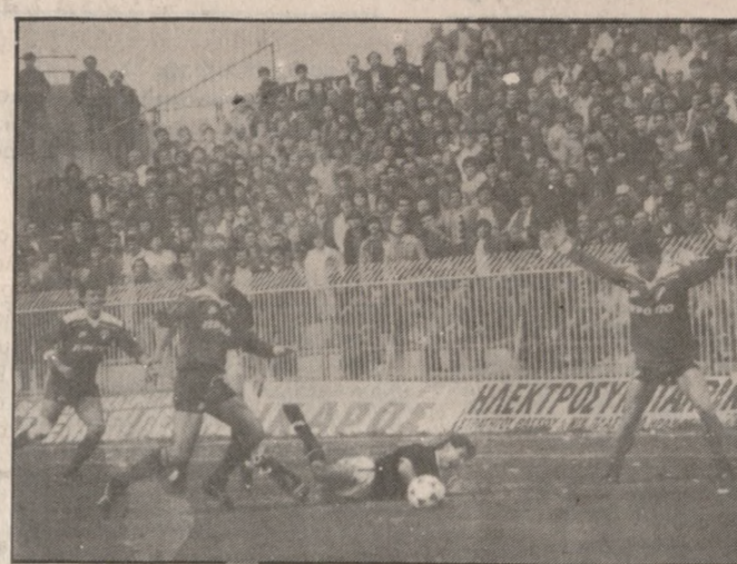
Η φάση που έγινε το πέναλτι.