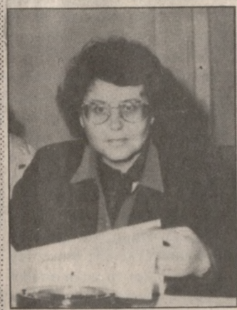
Αμφίλοχος να πάει Νομάρχης στο Λασιθί, ή θα προτιμήσει την έδρα στο Πανεπιστήμιο.

Στέλεχος της ΕΓΕ από Ηράκλειο Νομάρχης σε νησί