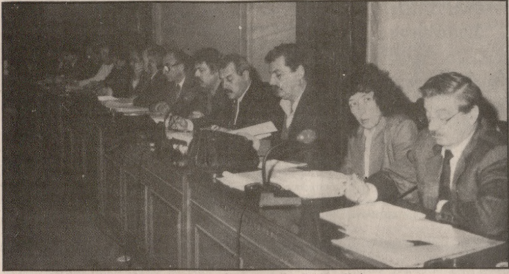
Από τη συνεδρίαση του Περιφερειακού Συμβουλίου Κρήτης.

ΕΝΩ ΤΟ ΥΠΟΥΡΓΕΙΟ ΕΘΝΙΚΗΣ ΟΙΚΟΝΟΜΙΑΣ ΠΡΟΤΕΙΝΕΙ 120 ΔΙΣ