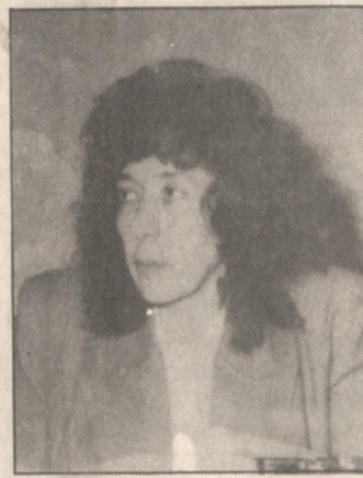
Παραμένει Νομάρχης Ρεθύμνου.