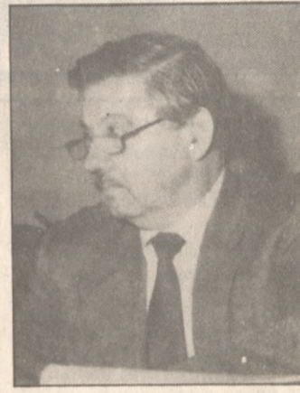
Άγνωστο αν παραιτηθεί για να πολιτευθεί.

στην ημέρα των εκλογών και ενώ όλοι γνωρίζουν ότι πολύ πριν σταματά αντικειμενικά κάθε δραστηριότητα του κυβερνητικού μηχανισμού.