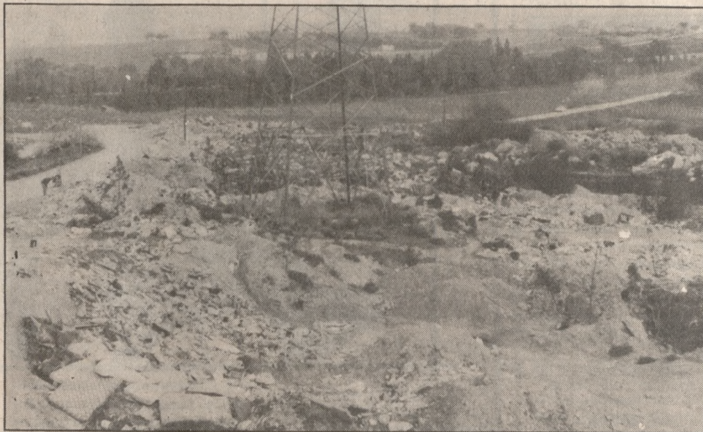
σμένο να συζητηθεί την Τρίτη στο Δημοτικό Συμβούλιο και στη συνέχεια θα προχωρήσει η προ-σμού ιδεών. Νίκος Μαρκάκης