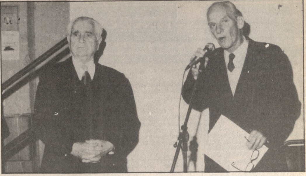
ΑΝΑΦΟΡΑ ΣΤΟ ΕΡΓΟ ΚΑΙ ΤΟΥΣ ΑΓΩΝΕΣ ΤΟΥ