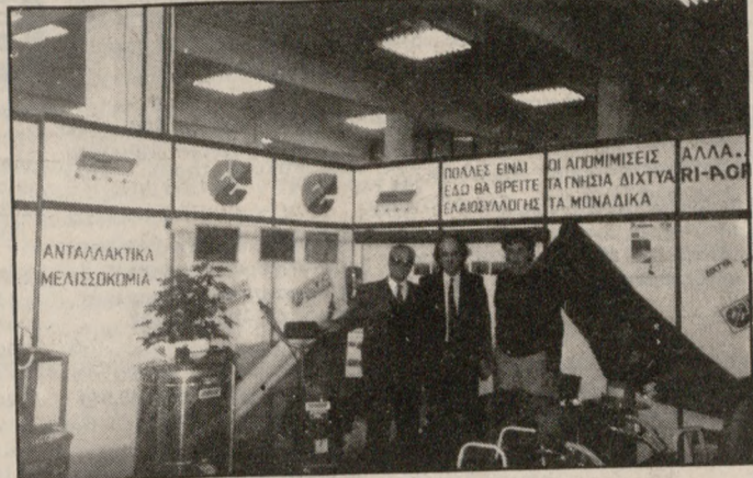
Από το περίπτερο της ΕΑΣΗ στην 'ΑΓΡΟΤΙΚΑ'