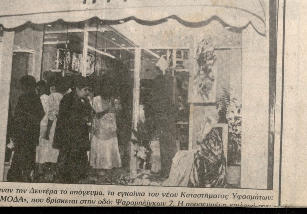
Εγίναν την Δευτέρα το απόγευμα, τα εγκαίνια του νέου Καταστήματος Υφασμάτων «Η ΜΟΔΑ», που βρίσκεται στην οδό: Ψαρομυλίων 7. Η παρασημειωμένη Υφασματοποιός