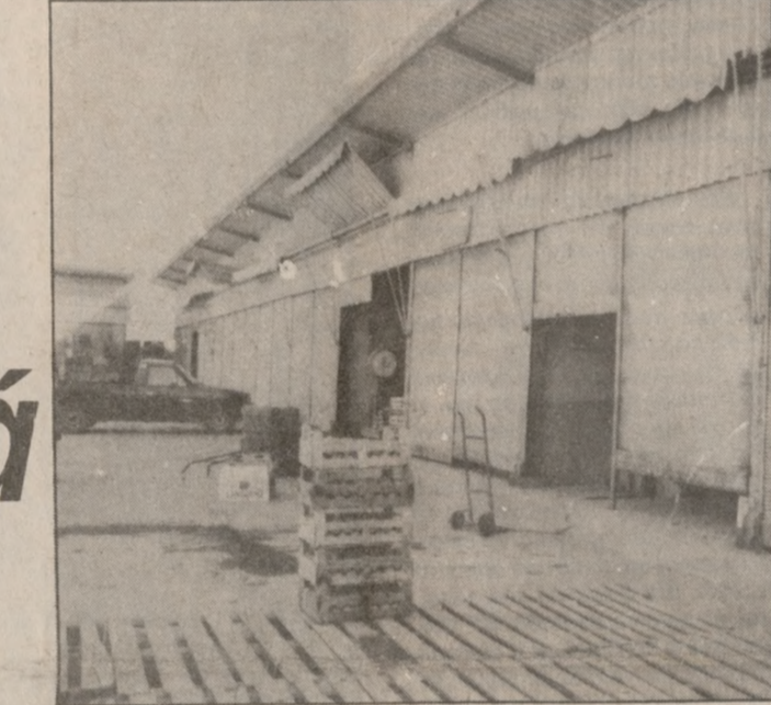
Όλα σχεδόν κλειστά στη συνεταιριστική λαχαναγορά. Σε λίγο αναμένεται να μπει οριστικά λουκέτο...

Έχοντας ένα άνοιγμα που ξεπερνά τα 200 εκατομμύρια δραχμές με σημαντικά χρέη προς παραγωγούς, δημόσιους οργανισμούς, υπηρεσίες και Τράπεζες, βάζει λουκέτο οριστικά, σύμφωνα με έγκυρες δημοσιογραφικές πληροφορίες, η συνεταιριστική λαχαναγορά του Ηρακλείου, η πρότυπη αυτή μορφή συνεταιριστικής οργάνωσης για ολόκληρη τη χώρα, στην οποία ο αγροτικός κόσμος του νομού στήριξε πάρα πολλά παλιότερα... Οι Ενώσεις και οι συνεταιρισμοί που την δημιούργησαν αλλά και οι ίδιοι οι παραγωγοί οδηγήθηκαν σε απόγνωση και στο τελικό κλείσιμο της θεωρώντας ότι δεν «καλύφθηκαν» από την πολιτική και τα αρμόδια κυβερνητικά όργανα, τα οποία χρόνια και χρόνια προέτρεπαν για την εκδίκωση «κοινωνικής πολιτικής» χωρίς όμως στα κρίσιμα σημεία να καλύπτονται τα αναπόφευκτα ανοίγματα. Και τώρα απλώς παρακολουθούν την αντίστροφη πορεία προς το τέλος... ΚΑΤΑ ΤΩΝ ΜΕΣΑΖΟΝΤΩΝ Στη συνεταιριστική λαχαναγορά του Ηρακλείου που δημιουργήθηκε το 1983, την