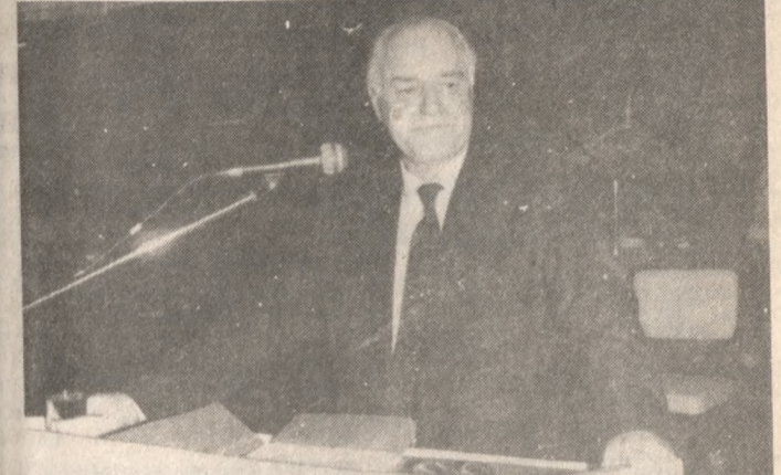
Ο Υπουργός Προεδρίας κ. Κουτσογιώργας μιλώντας στη συνεστιάση της ΟΕΣ.

Παράλληλα κατάγγειλε ως υπνομετέτες της ομαλότητας τη νησίδα της Νέας Δημοκρατίας η οποία όπως είπε καλύπτει με το προσώπιο του νεοφιλελευθερισμού και της νεοδεξιάς, λέγοντας χαρακτηριστικά ότι με αργυρία προδίσει με κατασκευάζονται κυβερνήσεις όπως άλλότε ενώ η εκμετάλλευση όπως είπε της υπόθεσης Κοσκωτά θυμίζει στον δημοκρατικό λαό της ίδιας μεθοδεύσεις των κλών που χτύπησαν τον Βενιζέ-