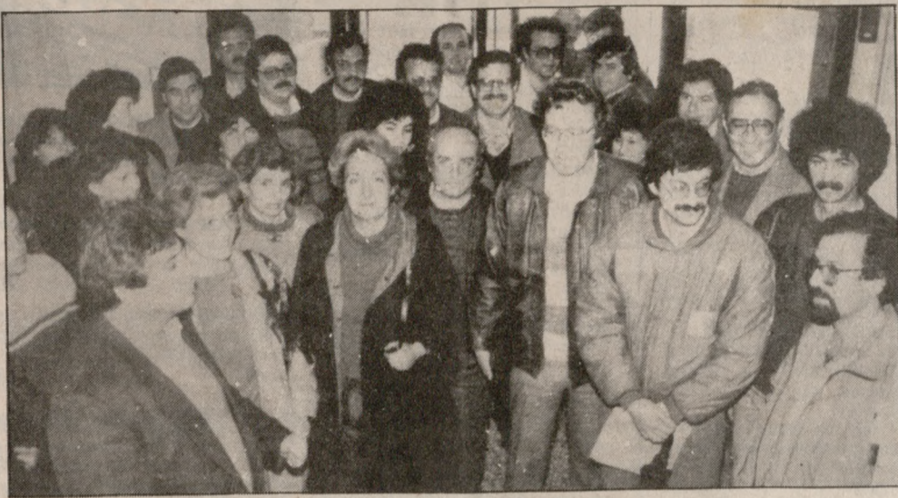
Από την συγκέντρωση των Μηχανικών του Δημοσίου.

Την ματαίωση της δημοπρασίας που αφορά την διάνοξη δρόμου προς το Αεροδρόμιο κόστους 70 εκ. δρχ. πέτυχαν χθες οι Μηχανικοί του Δημοσίου, μόνιμοι και επί συμβάσει, οι οποίοι πραγματοποίησαν τριώρη στάση εργασίας από τις 8.30-11.30 το πρωί.