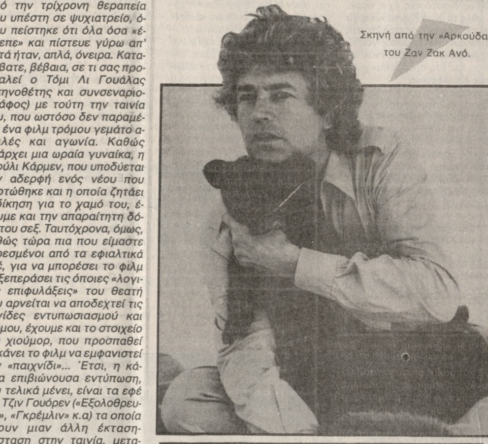
Σκηνή από την «Αρκούδα» του Ζαν Ζακ Ανό.