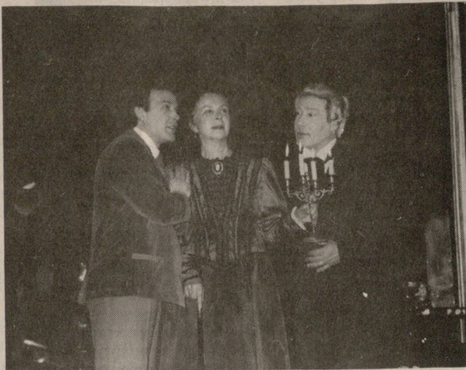
Από την παράσταση του έργου.