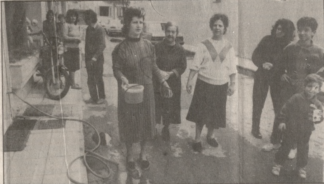
Εκπληκτες οι γυναίκες χθες το πρωί στον δρόμο.

ΣΥΝΔΡΙΑΖΕΙ ΤΟ ΔΣ ΤΗΣ ΔΕΥΑΗ Συνεδριάζει την Τετάρτη 29 συνέχεια στη σελ. 3