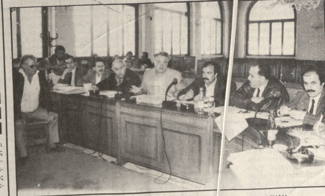
Απο την χθεσινή συνέντευξη Τύπου για το πρόγραμμα της ΔΕΥΑΗ