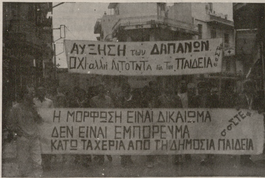
Στιγμιότυπο από προηγούμενη κινητοποίηση για την Παιδεία