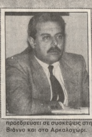
Πρόεδρος σε συσκέπηση στην Βίαινα και στο Αρκαλοχώρι.