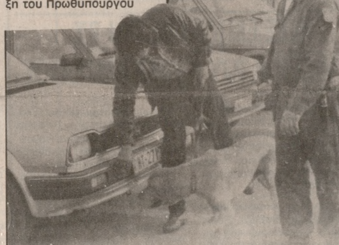
Αντιπρομοκρατικός ακυβερνών αυτοκίνητος πριν την άφιξη του Πρωθυπουργού