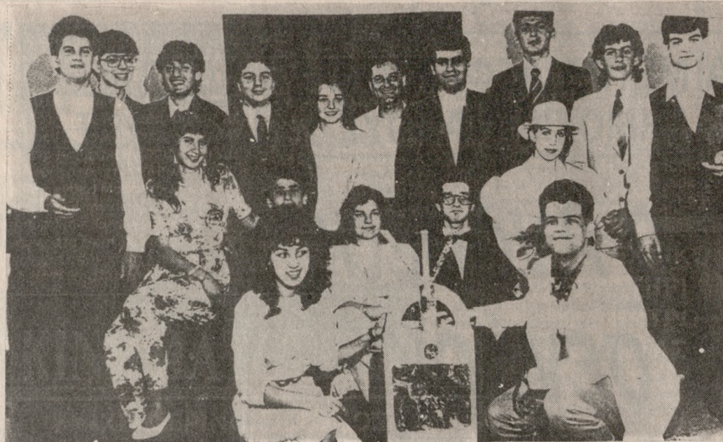
Η Θεατρική Ομάδα του Λυκείου Αλικαρνασσού.