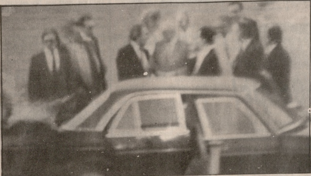
Η «Πατρίς» κατάφερε να φωτογραφίσει την άφιξη του Πρωθυπουργού και της κ. Λιάνη, παρά την ασυμμετρική των εκπροσώπων του τύπου από το αεροδρόμιο. Τον Πρωθυπουργό υποδέχονται ο υπουργός ΠΕΧΟΔΕ κ. Παπασπυράκης, ο Διοικητής του ΠΑΣΟΚ κ. Ασημένιος, ο Περιφερειάρχης κ. Λουκάκης, ο Νομάρχης Ηρακλείου κ. Τζουρακάνης και Λασιθίου κ. Μπουρζαζάκης ο Δήμαρχος κ. Καρέλλης κ.α.

Αντιπρομοκρατικός ακυβερνών αυτοκίνητος πριν την άφιξη του Πρωθυπουργού