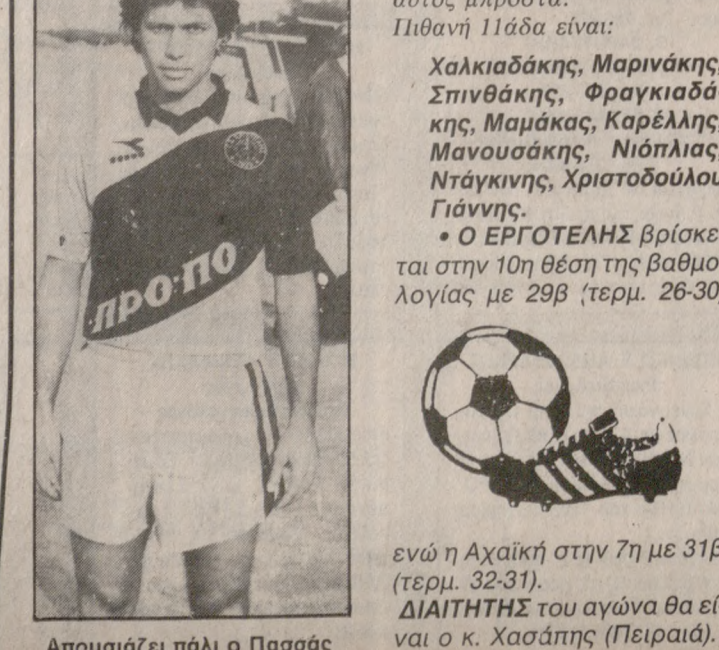
Απουσιάζει πάλι ο Πασάς