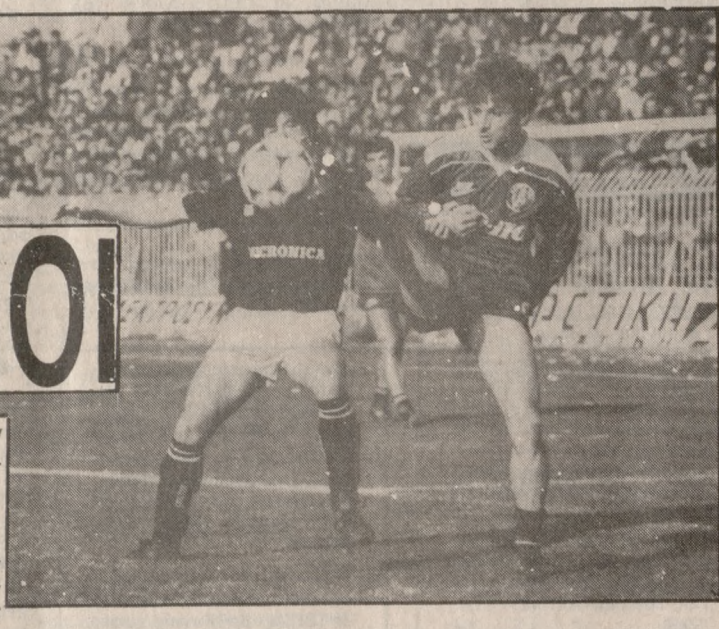
Ο Βέρα μάχεται στον δραματικό αγώνα με την Λάρισα στο Κύπελλο.

Μετά από έκτακτη συνεδρίαση το Δ.Σ. της ΠΑΕ-ΟΦΗ αποφάσισε τη συμμετοχή της ομάδας μας στον αγώνα ΟΦΗ-ΛΑΡΙΣΑ στο γήπεδο Ν. ΦΙΛΑΔΕΛΦΕΙΑΣ.