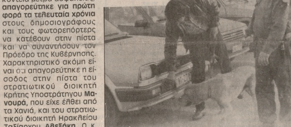
Αντιπρομοκρατικός ακυβερνών αυτοκίνητος πριν την άφιξη του Πρωθυπουργού