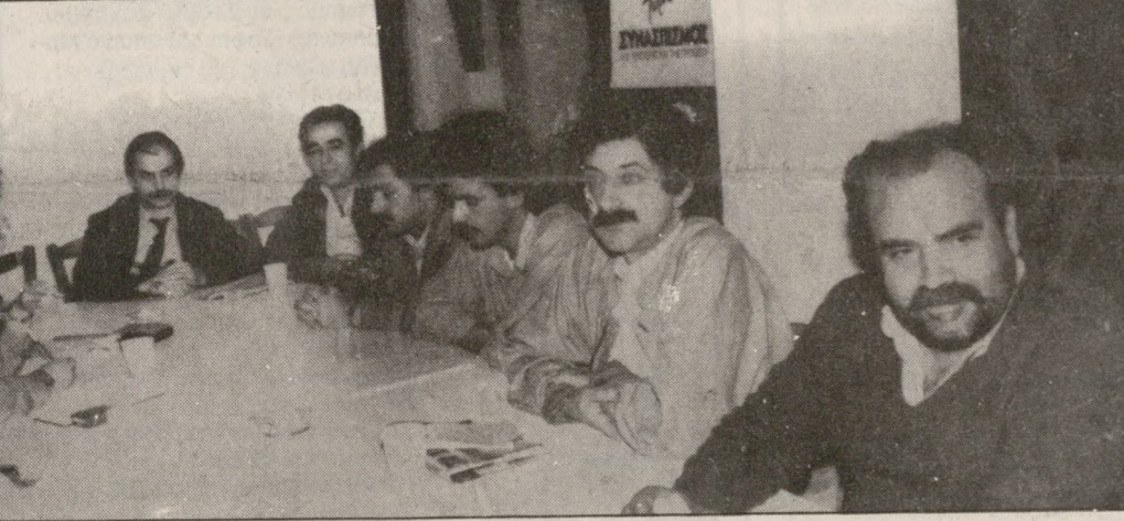
Μέλη της γραμματείας του Συνασπισμού στη χθεσινή συνέντευξη

σίας του στις συνοικίες και τα χωριά του νομού ο Συνασπισμός της Αριστεράς της Προόδου. Η εξόρμηση αυτή, όπως είπαν συνέχεια στη σελ. 4