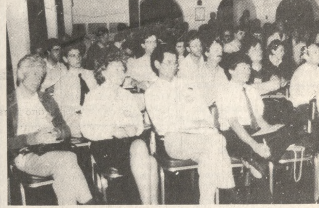
Άποψη από το συνέδριο στο Καψής