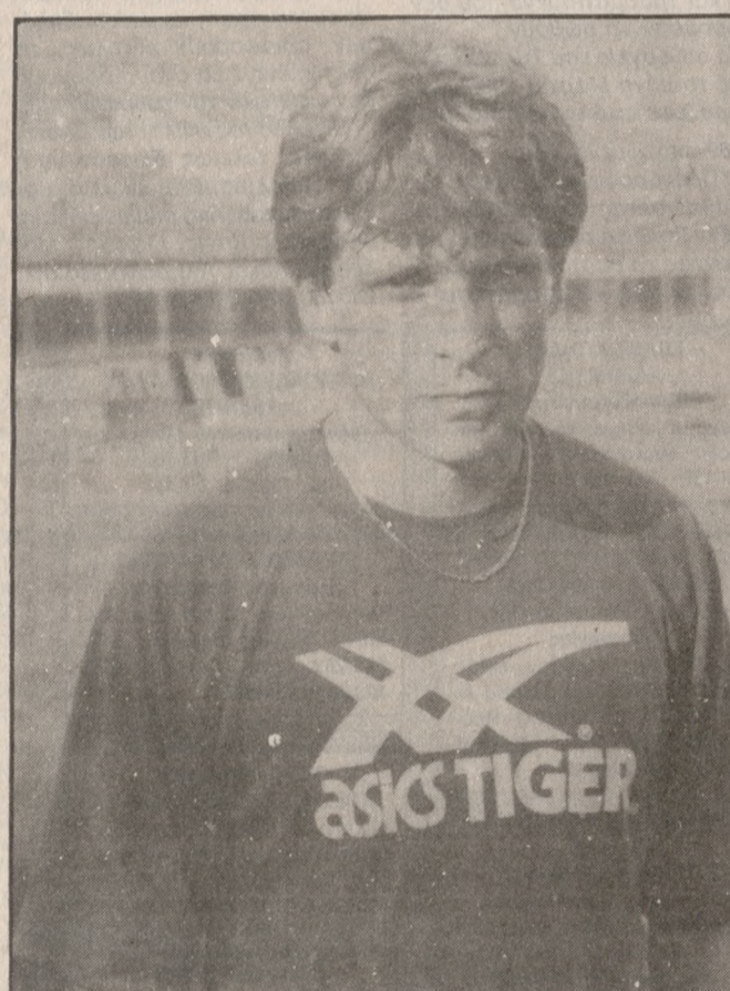
Ο Βλαστός θα παίξει σήμερα για δεύτερη συνεχή φορά μπακ χωρίστως έτσι τις ανάγκες της ομάδας του που αγωνίζεται στη Θεσσαλία με τον Άρη.

Η Γενική Συνέλευση των μελών της ΑΕΚ θα πραγματοποιηθεί αύριο στις 6 μ.μ. στα γραφεία του Συλλόγου.