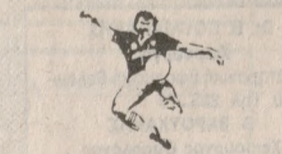
επόπτες οι κ.κ. Αρσένου και Μεντζάκης. 5μμ. Πατούχας-Τριτωνία, γήπεδο Βιάννου, διατητής ο κ. Ιωαννίδης, επόπτες ο κ. Ντανάλης. Αποστόλ.-Ίκαρος Αμ., γήπεδο Καστελλίου. ΒΟΛΕΙ Κένταυρος-Γιούχτας (Π) στα Χανιά στις 11πμ. Νεανιδών Άθληση-ΓΕΗ, στο κλειστό Ηρακλείου στις 3μμ. Κύδων-Αρκάδι, στα Χανιά στις 6.30πμ.

νικής, διατητής ο κ. Σιβακτάκης, επόπτες οι κ.κ. Σιωπηρός-Κασσωτάκης. Χειμαρρός-Ζαρός, γήπεδο Χουστολιανών, διατητής ο κ. Τσαϊνής, επόπτες οι κ.κ. Κοκκινάκης-Αντωνάκης. Ρούκος-Μοίρες, γήπεδο Αγίου Μύρων, διατητής ο κ. Καβροχωριανός, επόπτες οι κ.κ. Παξιμαδός-Ταβερναράκης. Γόρτυς-Αστραπή, γήπεδο Μοιρών, διατητής ο κ. Κουλεντάκης, επόπτες οι κ.κ. Μ. Χρυσός και Σπυριδάκης. Γ' Κατηγορία 11πμ. Χουδέτσι-Ηρακλής, γήπεδο Αρχανών, διατητής ο κ. Σπυριδάκης, επόπτες οι κ.κ. Αρσένου-Κασσωτάκης. Γούβες-Μοχός, γήπεδο Γουβών, διατητής ο κ. Βασιλειάδης, επόπτες οι κ.κ. Καπελάκης-Σιωπηρός. ΠΟΗ-Γωνιές, γήπεδο ΕΓΟΗ, διατητής Παπουτής, επόπτες οι κ.κ. Χρυσός-Μ. Αντωνάκης. 1.30πμ. Μάρθαρος-Ηρακλής Ηρ., γήπεδο ΕΓΟΗ, διατητής ο κ. Παπανδρόπουλος, επόπτες οι κ.κ. Μεντζάκης και Μουστακάκης. 2.30πμ. Κολυμβήση