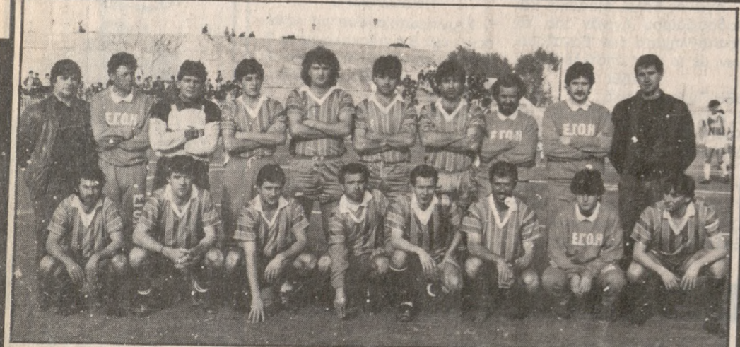
Ο ΕΓΟΗ παίζει σήμερα Κύπελλο στο γήπεδό του