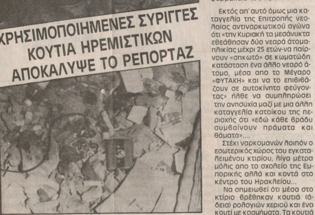
Μπουκαλάκια και κουτιά υπνωτικών φαρμάκων στο εσωτερικό του κτιρίου.

Σε στέκι ναρκομανών έχει μετατραπεί μέρος του εγκαταλειμμένου μεγάρου φυτάκη όπως απέδειξε ρεπορτάζ της «Π».