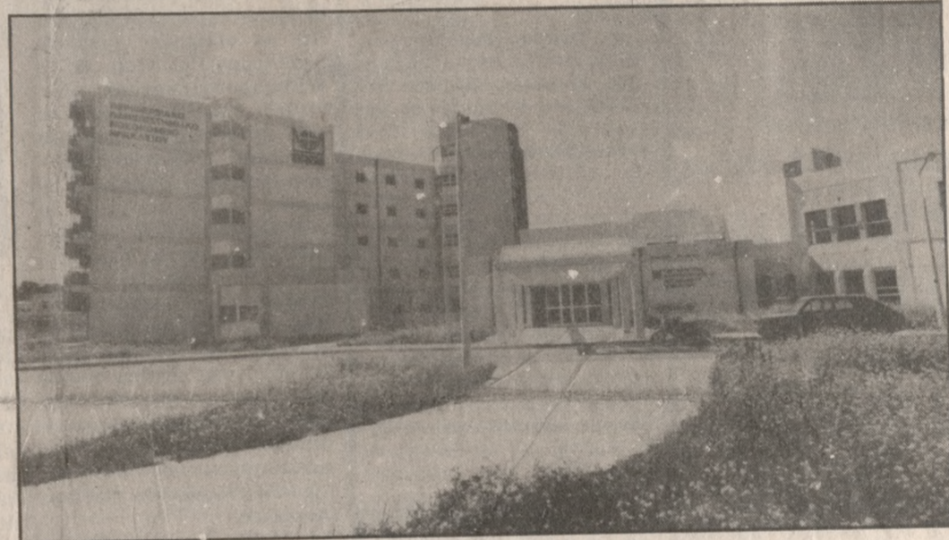
Νέα πρόταση με στόχο την επίσημη λειτουργία του Πανεπιστημιακού Νοσοκομείου.

Πρόταση πρακτικά και άμεσα εφαρμόσιμη, που εξυπηρετεί και το στόχο της όσο το δυνατό ταχύτερης έναρξης λειτουργίας των νοσηλευτικών τμημάτων του Πανεπιστημιακού Νοσοκομείου, ενώ παράλληλα ανακουφίζει το βεβαρημένο Βενιζέλειο, έκανε χθες, με ανακοίνωση της στον Τύπο, η τριμελής Επιτροπή των γιατρών του Βενιζέλειου, εφαρμόζοντας απόφαση της γενικής συνέλευσης.