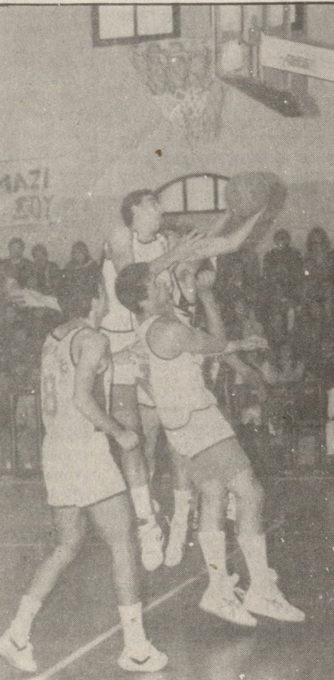
Κυριακή ΑΡΚΑΔΙ-ΑΓΟΡ: γήπεδο Ρεθύμνου, ώρα 7μμ., διαιτητές οι κ.κ. Μαγγανός και Κουρκουνακός.

ΠΕΡΙΣΤΕΡΙ-ΑΝΔΡΟΓΕΩ: κλειστό Χανίων, ώρα 4μμ., διαιτητές οι κ.κ. Χριστινάκης και Αντισάκης.