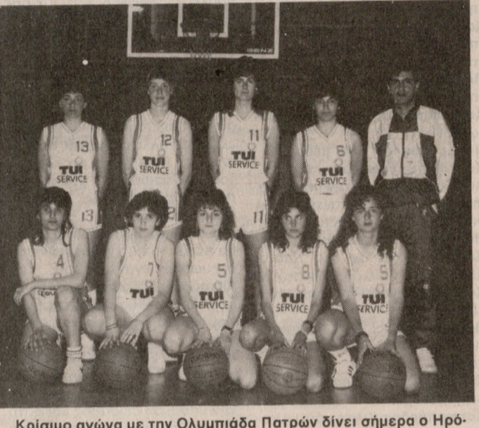
Κρίσιμο αγώνα με την Ολυμπιάδα Πατρών δίνει σήμερα ο Ηρόδοτος. Αν κερδίσει προκρίνεται στην τελική φάση