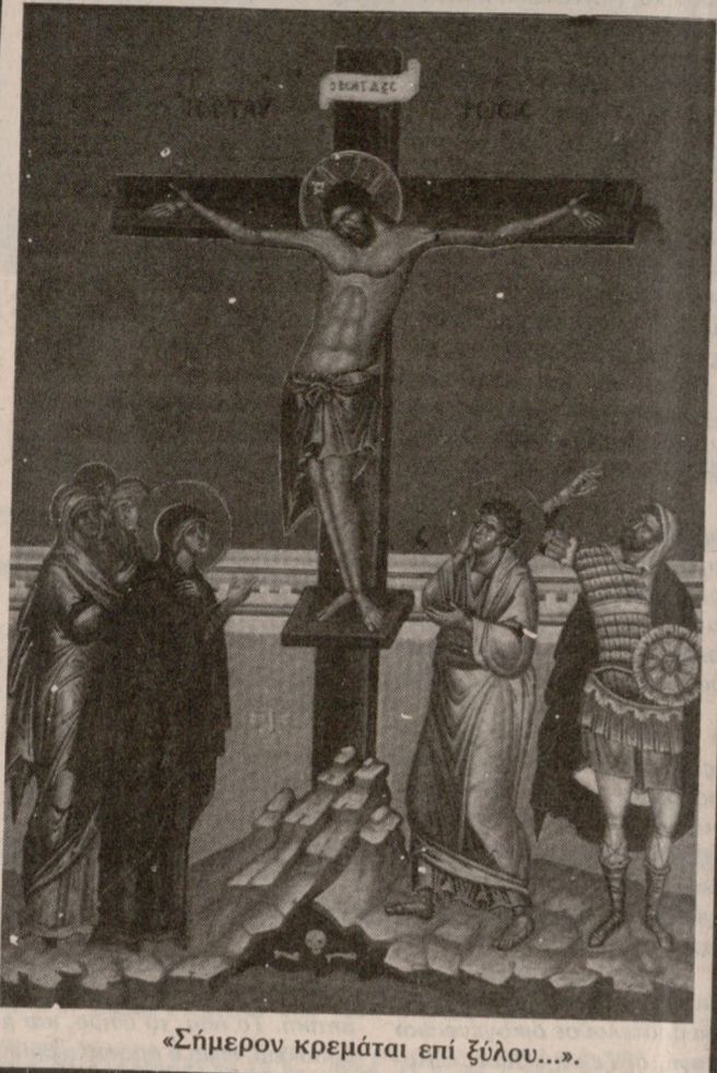
«Σήμερον κρεμάται επί ξύλου...»