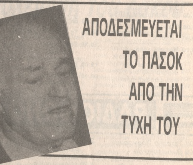
ΑΠΟΔΕΣΜΕΥΕΤΑΙ ΤΟ ΠΑΣΟΚ ΑΠΟ ΤΗΝ ΤΥΧΗ ΤΟΥ

• Αρνήθηκε να υπογράψει εξουσιοδότηση, με την οποία, βουλευτές μέλη της επιτροπής, θα μπορούσαν να μεταβούν στην Γενεύη και να πάρουν από την Τράπεζα ΣΙΤΥ ΚΟΡΠ, όλα τα απαραίτητα στοιχεία σχετικά με την υπόθεση των δύο εκατομμυρίων δολλαρίων.