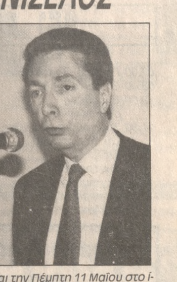
Και την Πέμπτη 11 Μαΐου στο ίδιο κανάλι και την ίδια ώρα.

Στα Χανιά θρίσκειται από χθες ο Πρόεδρος του Κόμματος των Φιλελευθέρων Κ. Νικήτας Βενιζέλος. Κατά την παραμονή του στα Χανιά ο κ. Βενιζέλος θα παραρευθεί και θα μιλήσει στα αποκαλυπτήρια της προτομής του σεμνήστου υπουργού Πολυχρόνη Πολυχρονιδη και θα περιούσει περιοχές του Νομού Χανίων.