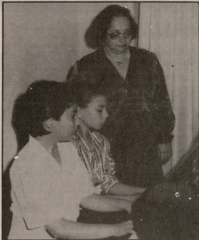
Παιδιά του Ωδείου στο πιάνο

Μουσική εκδήλωση από τους μικρούς μαθητές πιάνου του Ολυμπιακού Ωδείου θα γίνει το Σάββατο 20 Μαΐου στις 8 το βράδυ στην αίθουσα της Βασιλικής του Αγίου Μάρκου.