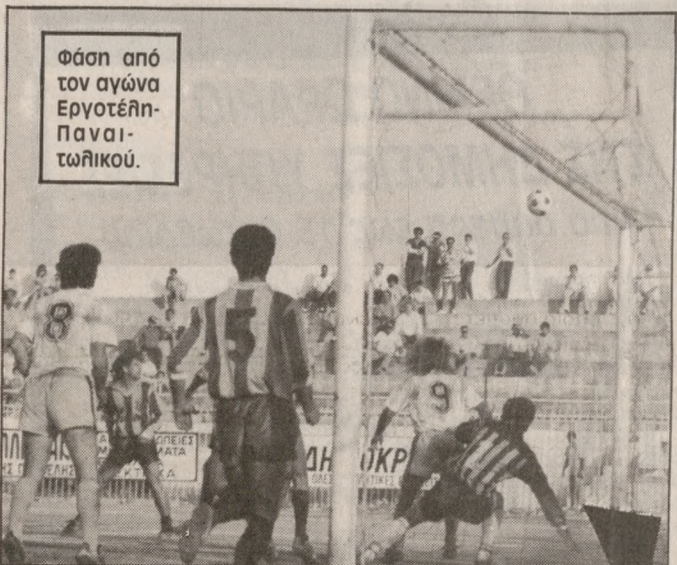
Φάση από τον αγώνα Εργοτέλης-Πανατωλικού.