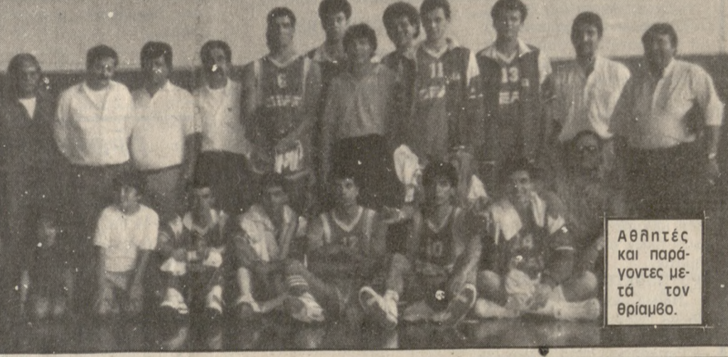
Αθλητές και παράγοντες μετά τον θρίαμβο.

Με 3-2 ο Ερασιτέχνης Ηρόδοτος έχασε εκτός από την Λάρισα για το Πρωτάθλημα. Τα γκολ πέτυχαν οι Αγαπητός και Κολιτσόγλου.