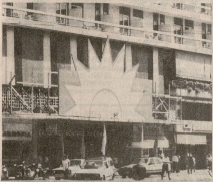
Το εκλογικό κέντρο του ΠΑΣΟΚ στο Ηράκλειο