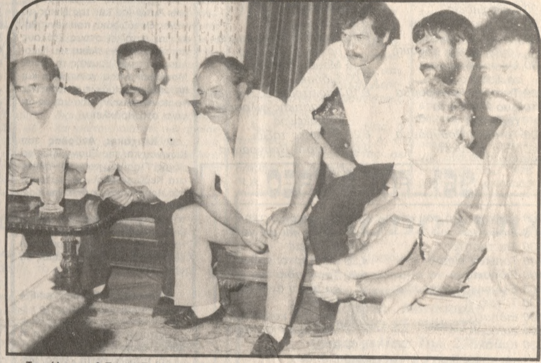
Τα μέλη του Δ.Σ. του Συλλόγου Ιδιοκτητών Αγοραίων Αυτοκινήτων στο γραφείο του Νομάρχη.