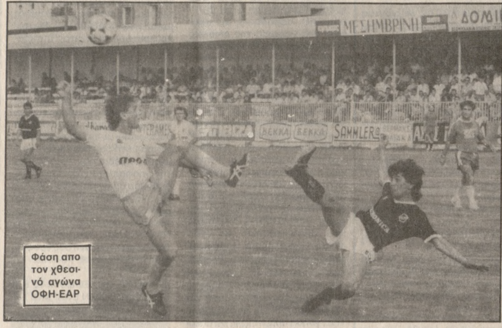
Φάση από τον χθεσινό αγώνα ΟΦΗ-ΕΑΡ

λύ ρίσκο που της βγήκε σε καλό, αφού κέρδισε με 4-3 την Λοκομπίβ. Έχει δυνατά παιδιά από τα οποία τα περισσότερα έχουν αγωνισθεί στην Ευρώπη». ΤΕΛΟΣ για την ΕΑΡ ο κ. Γκέραρντ είπε: «Είναι καλή ομάδα και έχει στην δύναμή της πέντε ποδοσφαιριστές που μπορούν να παίξουν στην Α' Εθνική».