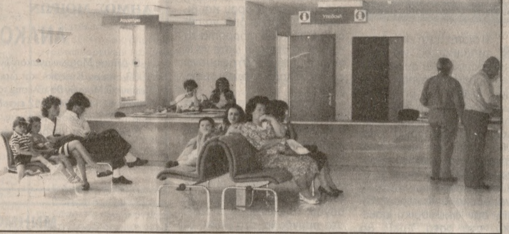
Οι πρώτοι ασθενείς στους χώρους υποδοχής του Πανεπιστημιακού Νοσοκομείου.

Στο μεταξύ στο θέμα της έναρξης λειτουργίας του Νοσοκομείου αναφέρεται ανακοίνωση του Δ.Σ. του Συλλόγου φοιτητών Ιατρικής του Πανεπιστημίου Κρήτης με έκκληση παρακαλούμε την προετοιμασία των εγκαινίων του Περιφερειακού Πανεπιστημιακού Νοσοκομείου Ηρακλείου (Πε.Π.Γ.ΝΗ) που σκόπιμα επιχειρείται να ταυτιστεί με την έναρξη λειτουργίας του.