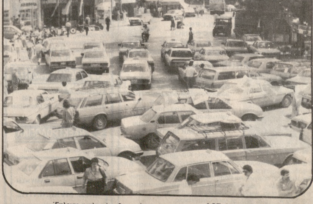
Έκλεισε η πλατεία χθες από τα αγοραία.