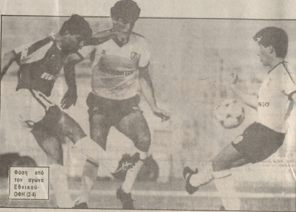
Φάση από τον αγώνα Εθνικού-ΟΦΗ (2-4)

ΕΝ ΨΥΧΡΩ εκτέλεσε ο ΟΦΗ τον Εθνικό (4-2), την Κυριακή στο Στάδιο Καραϊσκάκη - στο κλείσιμο της αυλαίας του πρωταθλήματος Α' Εθνικής - και τον έστειλε, για πρώτη φορά από την καθιέρωση του θεσμού, στην Β' Εθνική Κατηγορία. Με την νίκη του αυτή το συγκρότημα του κ. Γκέρραρτ καταβύθη στην 14η θέση στην τελική βαθμολογία του πρωταθλήματος. Πολλά αποδείχθηκαν με την νίκη αυτή του ΟΦΗ και κυρίως ότι είναι πολύ άδικο που μένει έξω από την Ευρώπη. Και μένει έξω γιατί από πολλές πλευρές έγιναν λάθη που δεν έπρεπε να γίνουν. Ας ελπίσουμε ότι τα λάθη αυτά θα αποτελέσουν παράδειγμα και δεν θα επαναληφθούν στην νέα αγωνιστική περίοδο. Για να επανέλθουμε στο ματς με τον Εθνικό θα πρέπει να τονίσουμε ότι ο ΟΦΗ διέλυσε τις... φήμες και απέδειξε ότι σέβεται την ιστορία του. Μετά το 3-1 επί του Απώλλωνα οι Απολλωνιστές πικράθηκαν, γιατί ο ΟΦΗ δεν τους χάρηθηκε, ενώ τώρα ήλθε η σειρά των Εθνικών.