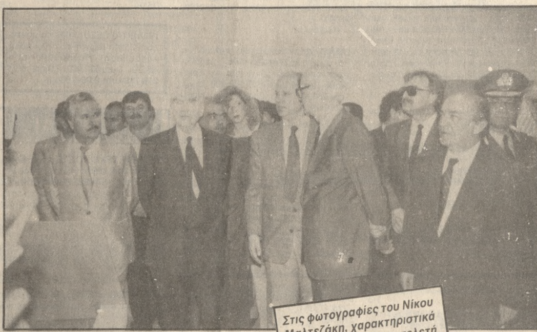
Στις φωτογραφίες του Νίκου Μαλτεζάκη, χαρακτηριστικά στιγμιότυπα, από την τελετή των εγκαινίων του Πανεπιστημιακού Νοσοκομείου, από τον Πρωθυπουργό κ. Ανδρέα Παπανδρέου.

γείας «στα πλαίσια του ΕΣΥ-στην περιφέρεια Κρήτης, αναφέρθηκε ο υπο-ργός Υγείας Απόστολος Κακλαμάνης , που είπε ότι στους τέσσερις νομούς του νησιού, λειτουργούν 8 νοσοκομεία-πλην εκείνου που εγκαινιάσθηκε χθες-16 Κέντρα Υγείας και 123 περιφερειακά και αγροτικά ιατρεία. Για την ανέγερση κτιριακών εγκαταστάσεων των Κέντρων Υγείας, έχει δαπανηθεί ποσό 1,3 δις δραχμών, ενώ βρίσκονται σε εξέλιξη έργα για την ενίσχυση της νοσοκομειακής υποδομής, πρόσθεσε ο υπουργός, που σημείωσε ακόμη ότι οι γιατροί που υπηρετούν σ' ολόκληρη την Κρήτη, από 580 το 1981 σήμερα φθάνουν τους 1.300. «Από τα στοιχεία αυτά-είπε-βγαίνει αβίαστα το συμπέρασμα, ότι το ΕΣΥ ριζώνει και δίνει τα αποτελέσματα του στην Κρήτη, γι' αυτό ο ελληνικός λαός το εμπιστεύεται και το στηρίζει».