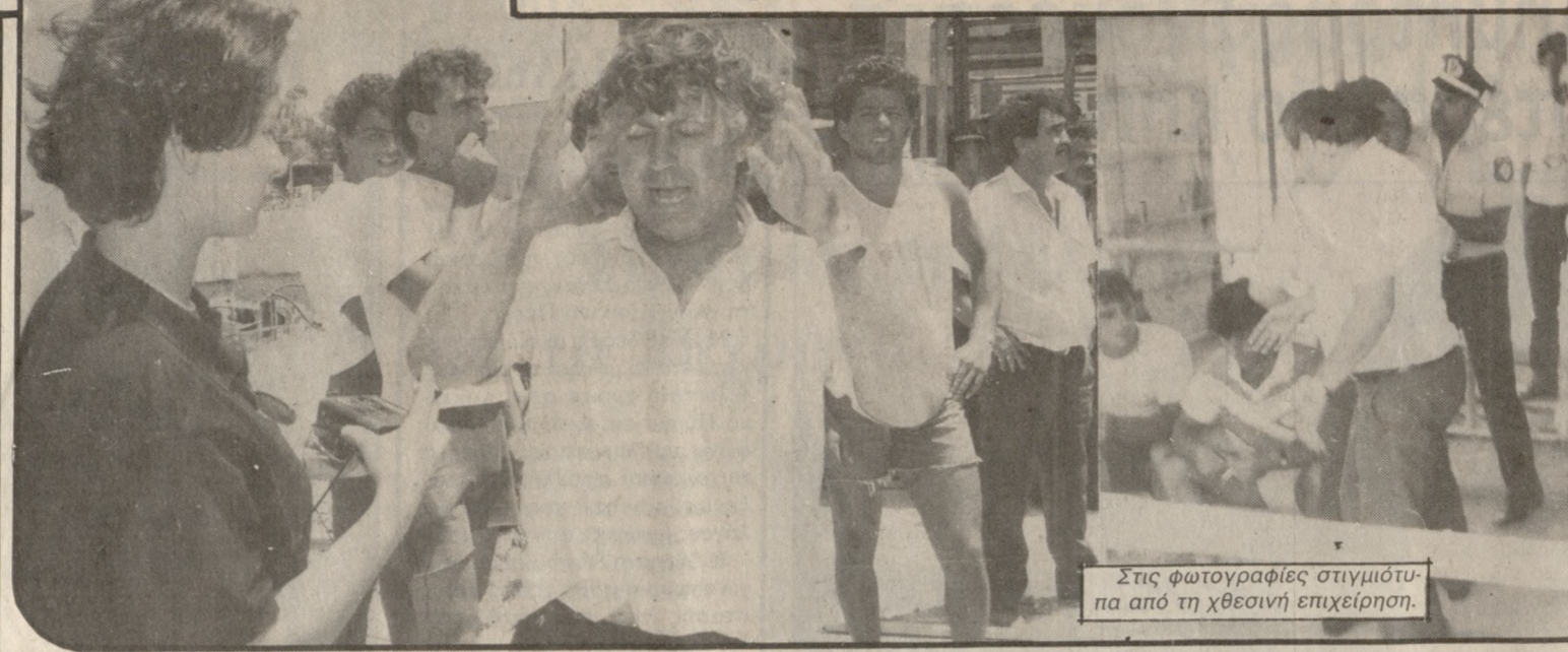
Στις φωτογραφίες στιγμιότυπα από τη χθεσινή επιχείρηση.