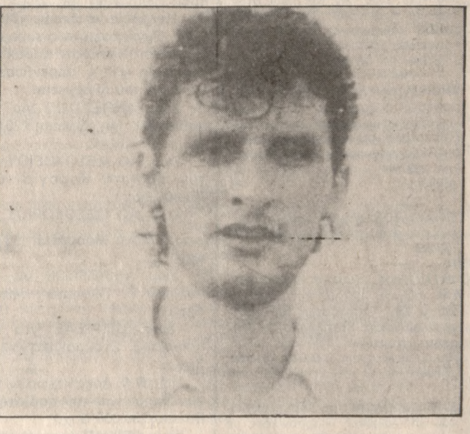
Την Δευτέρα θα απαντήσει στον ΟΦΗ ο Καρασταμάτης