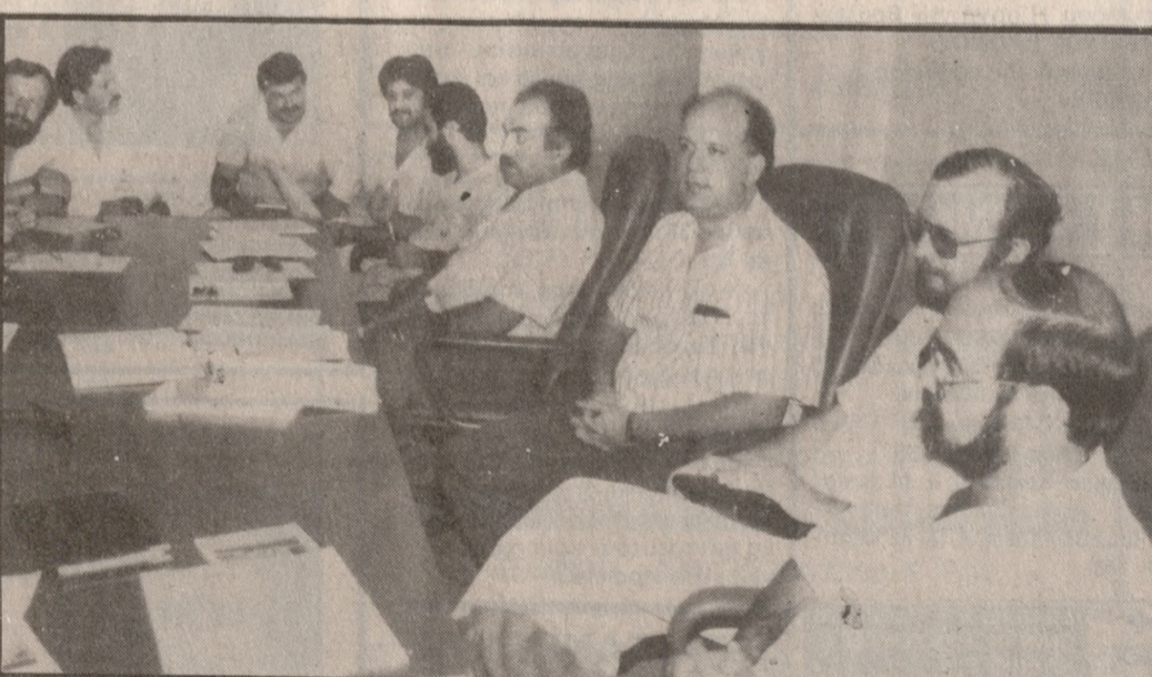
Απο την χθεσινή συνέντευξη Τύπου του έδωσαν τα μέλη του Δ.Σ. του Πανεπιστημιακού Νοσοκομείου.

Στο τηλεγράφημα αναφέρεται: «Υποβάλλομαι την παραίτησή μου από θέσεις στις οποίες είχαμε οριστεί με απόφαση του προκάτοχου σας Υπουργού έχοντας την αίσθηση ότι επρόκειτο να καθίκαν και προς το Νοσοκομείο, τον τόπο και τον Κρητικό λαό που σύντομα θα αισθανθεί την ευεργετική παρουσία του Νοσοκομείου στον χώρο της Υγείας. Αναγνωρίζοντας τις ιδιαίτερες τους μεγάλες έργου του Νοσοκομείου, στην κρίσιμη φάση της ανάπτυξής του, θα εξακολουθήσω να δίνω τον καλύτερο μου εαυτό και να συμβάλω στην ανάπτυξη του Νοσοκομείου, όπως και στην αντιμετώπιση των προβλημάτων που θα προκύψουν κατά την πορεία του Περιφερειακού Νοσοκομείου είτε: «Υπερβαλλομένη την παραίτησή μου-όπως άλλωστε και τα υπόλοιπα μέλη του Δ.Σ.-σκεπτόμενος ότι με αυτό τον τρόπο θα διευκολυνόταν να τον νέο Υπουργό να κάνει τις δικές του επιλογές. Πιστεύω ότι στο διάστημα της θητείας μας πραγματοποιήθηκε ένα τεράστιο έργο. Αναλάβαμε το δύσκολο έργο της οργάνωσης και της έναρξης λειτουργίας του, όταν στην Ελλάδα δεν υπήρχε καμιά παρόμοια εμπειρία. Ξεπεράσαμε δυσκολίες και αντιξοότητες. Αλλά με τη συμπαράσταση της Πολιτείας της οποίας Πολιτική βούληση ήταν η Αποκέντρωση στην Υγεία και η Αναβάθμιση της ποιότητάς της, λύσαμε ή δρομολογήσαμε προς την επίλυση όλα τα σημαντικά προβλήματα. Ήδη, το Νοσοκομείο ακολουθώντας το χρονοδιάγραμμα που έγκαιρα είχε εκπονηθεί, έχει ξεκινήσει τη λειτουργία του, ενώ κάθε μήνα νέα τμήματα του ξεκινούν.