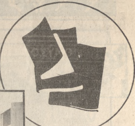
φωτογράφισης» κυρίως του Τουρκικού Αρχείου.