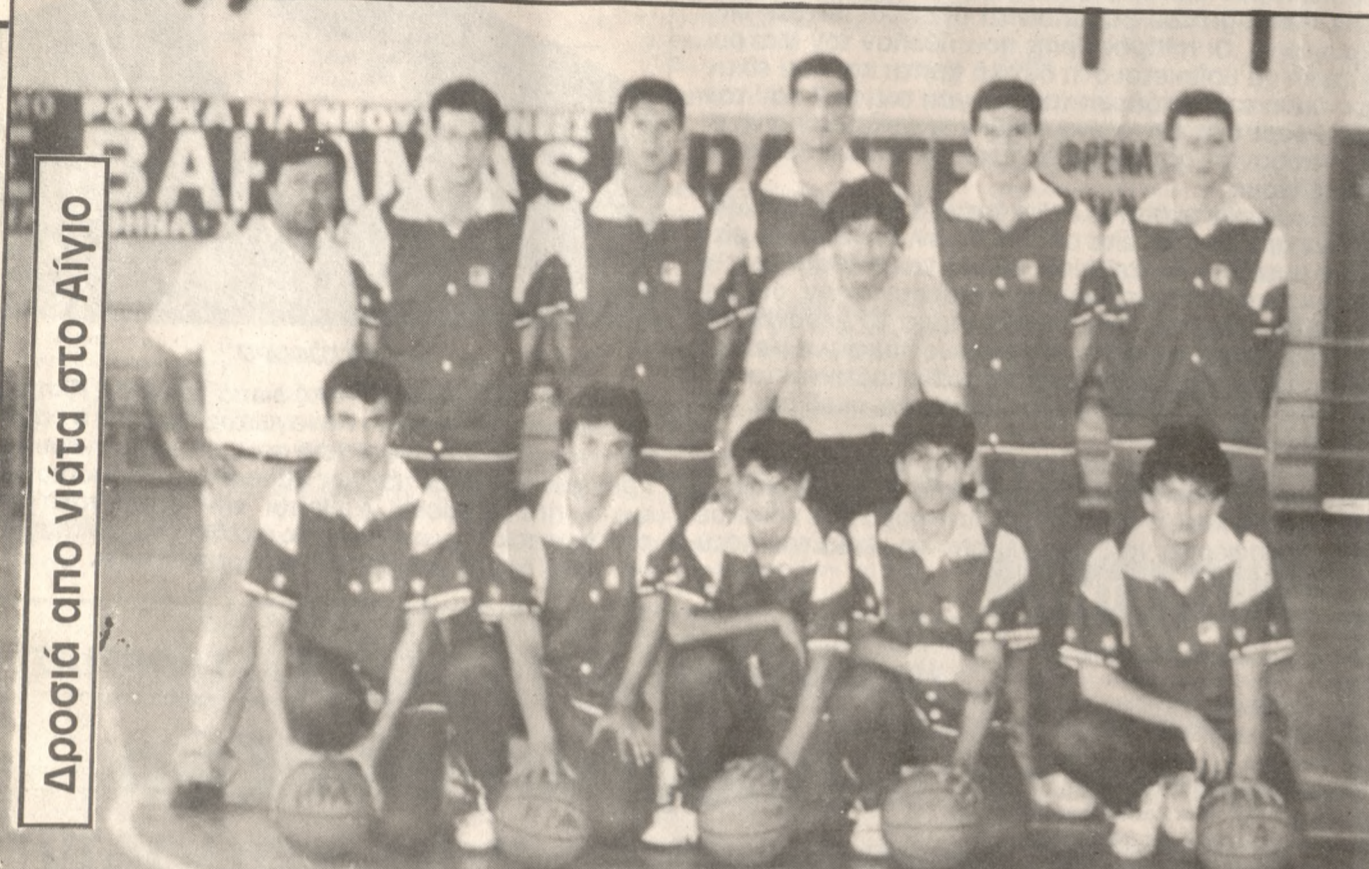
Δροσιά απο νιάτα στο Αίγιο

Η Εφηβική ομάδα του ΟΑΑΗ που λαμβάνει μέρος στο Πανελλήνιο Πρωτάθλημα που αρχίζει την Τρίτη στο Αίγιο.