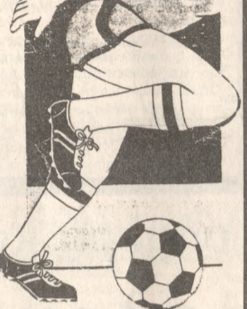
στις κλίκες των Αθηνικών ομάδων» (Γ. ΜΗΛΙΑΡΑΣ, πατέρας του ποδοσφαιριστή)

«ΔΕΝ ξεκινήσαμε καλά όμως εγώ δεν απογοητεύομαι. Θα συνεχίσω με τους παίκτες».