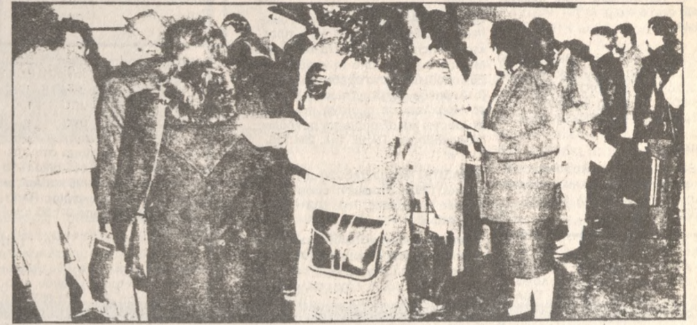
Μόνο οι φορολογικές δηλώσεις των μισθωτών και συνταξιούχων θεωρούνται ειλικρινείς και δεν θα ελεγχθούν

Με άλλη απόφαση του κ. Σαμαρά παρατείνεται μέχρι τις 31 Ιουλίου 1989 η προθεσμία καταβολής της τρίτης δόσης των χρεών προς το Δημόσιο που ρυθμίστηκαν τον Απρίλιο με καταβληθέν ως 24 μηνιαίες δόσεις και έπρεπε να καταβληθούν ως τις 12