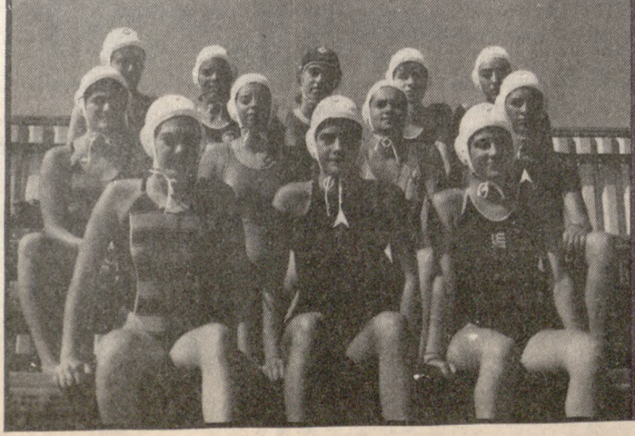
Η γυναικεία ομάδα πόλο του ΕΦΟΗ.

Συνεχίζονται σήμερα οι αγώνες πόλο της προκριματικής φάσης του Ομίλου Κρήτης για άνοδο στη Β' Εθνική Κατηγορία. Σύμφωνα με το πρόγραμμα θα γίνουν σήμερα και αύριο (ολοκληρώνεται) οι εξής αγώνες: Σήμερα Ν.Ο. Ρόδου-Ν.Ο. Χανίων στις 7μμ. ΚΟΗ-ΕΦΟΗ στις 8μμ. Αύριο ΕΦΟΗ-ΝΟΡ στις 10μμ. ΝΟΧ-ΚΟΗ στις 11μμ. Πρέπει να πούμε ότι οι 2 ομάδες που θα τερματίσουν πρώτες θα πάρουν τα εισιτήρια για την άνοδο.